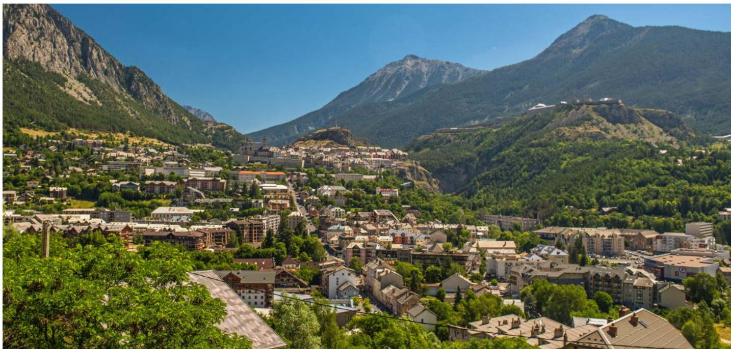
Ville fortifiée de Briançon avec la ville haute et les fortifications