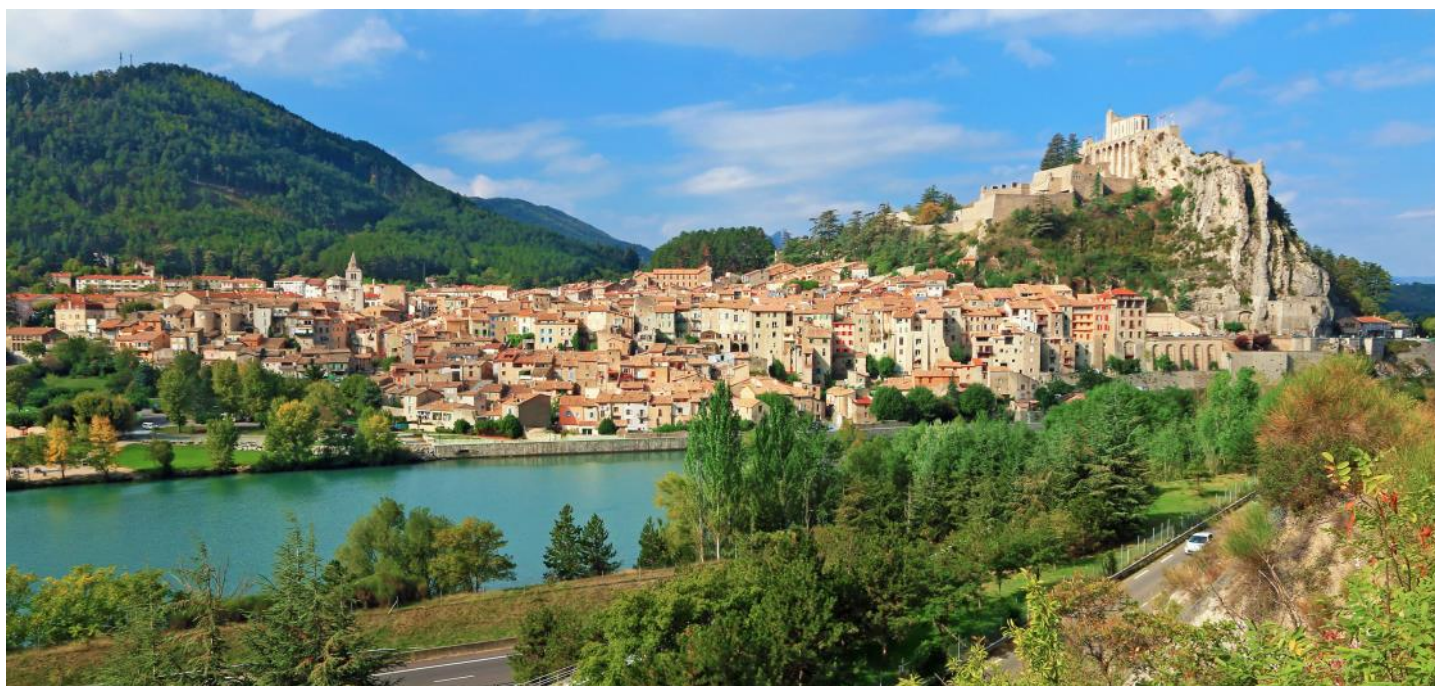
Vue sur la vieille ville de Sisteron, située sur la Durance