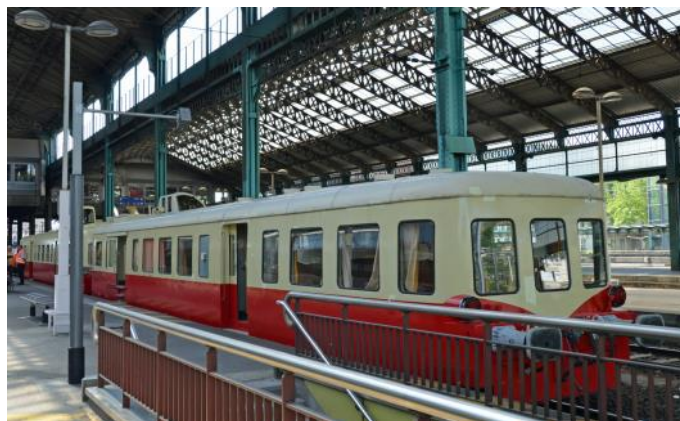
Notre train spécial en gare de Lyon Perrache

La ville de Gap est située à une altitude d'environ 750 m dans une large vallée sereine, au carrefour de deux axes de communication importants. C'est la « Route Napoléon » qui relie Grasse à Grenoble et la route départementale qui relie Valence dans la vallée du Rhône à Briançon. La ville est le centre économique du sud des Alpes françaises et compte environ 40'000 habitants. La ville fait partie de la région Provence-Alpes-Côte-d'Azur et est la préfecture du département des Hautes-Alpes. Les origines de la ville remontent à l'époque romaine et Gap est le siège d'un évêché depuis le 5 e siècle. La vieille ville avec ses ruelles étroites et sinueuses, qui dégagent une atmosphère méridionale, et la cathédrale néogothique avec sa tour de 77 mètres de haut valent le détour. A l'occasion de notre voyage, nous séjournerons trois nuits dans un hôtel de Gap.