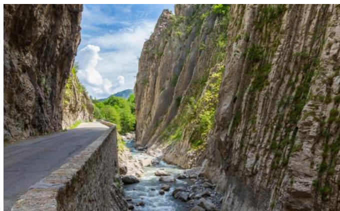
«Clues de Barles»