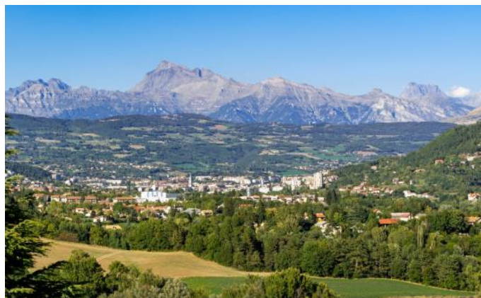
Vue sur la ville de Gap

Repas de midi à Digne-les-Bains et dîner à l'hôtel