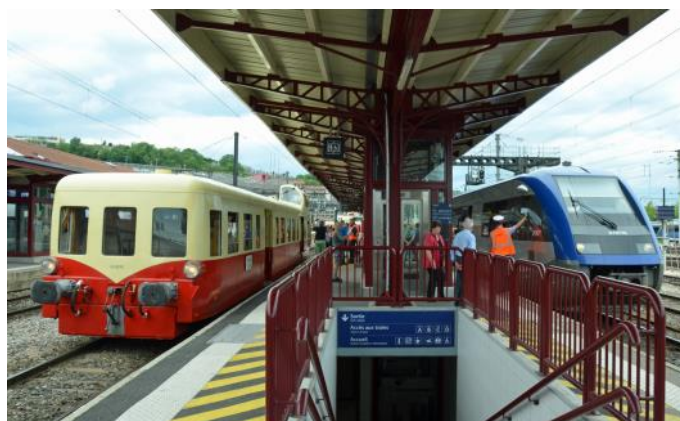
Train spécial lors d'un arrêt en cours de route

Lors de notre voyage, nous partons de Briançon avec un train spécial jusqu'à Dijon. Ce train est un autorail (automotrice diesel) historique de type « Picasso », construit en 1960 et exploité par l'association « Autorails de Bourgogne Franche-Comté » (ABFC) de Dijon. Le véhicule a le standard archaïque des transports en commun des années 1960, mais le nombre limité de participants permet néanmoins un voyage agréable. L'automotrice répond techniquement aux normes de la SNCF et est autorisée à circuler sur l'ensemble du réseau classique de la SNCF. Avec de tels véhicules associatifs, les voyages touristiques en France sont possibles à des conditions supportables. Pendant les deux jours de voyage, les passagers sont pris en charge par des membres de l'association ABFC qui sont également responsables du respect des règles de sécurité.