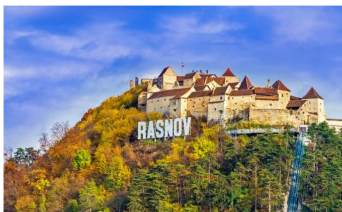
Château de fuite de Raşnov