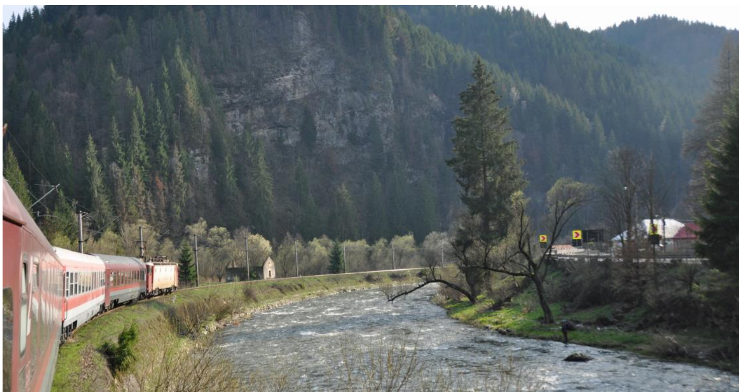
En train à travers des vallées pittoresques

La ville a été fondée au 13 ème siècle par l'ordre des chevaliers allemands sous le nom de Kronstadt. Brașov a également été rénovée de manière exemplaire ces dernières années et possède une grande zone piétonne. Il y a aussi de nombreuses curiosités, comme « l'église noire », la plus grande église-halle gothique du sud-est de l'Europe. La ville est entourée de montagnes et il vaut la peine de prendre le téléphérique jusqu'à la montagne locale « Tâmpa ». La ville compte environ 250'000 habitants, ce qui en fait la troisième plus grande ville de Roumanie.