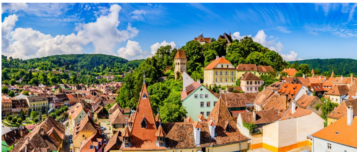
Vue sur la vieille ville de Sighișoara