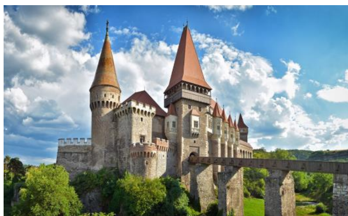
Le spectaculaire château de Hunedoara