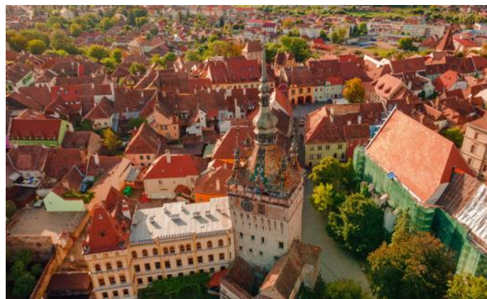
Sighișoara, ville historique

Sighișoara a également été fondée au 12 ème siècle par des colons allemands. Contrairement à Sibiu, les rénovations ont été peu nombreuses, si bien que la vieille ville dégage un charme historique et morbide. Aujourd'hui encore, la vieille ville est entièrement entourée de