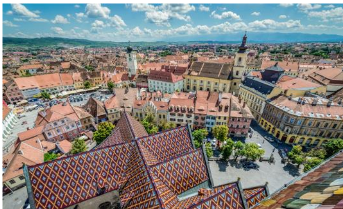
Sibiu, une ville magnifique