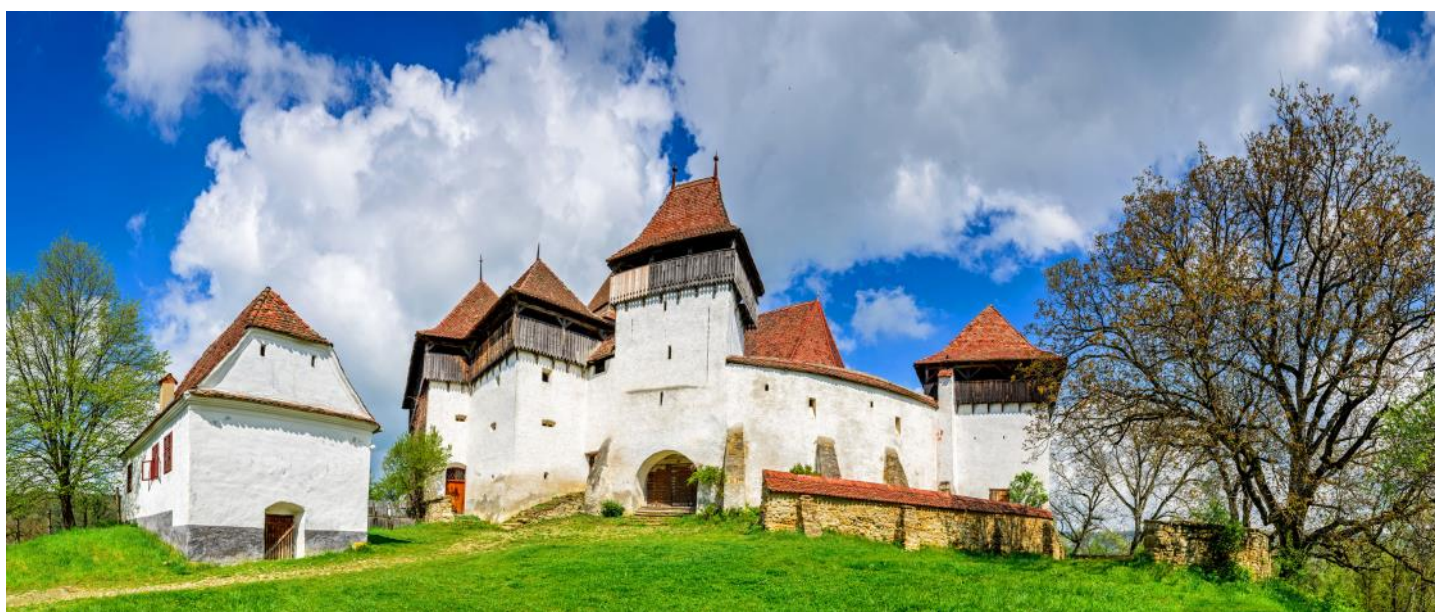
Vue sur l'église fortifiée de Viscri

En Transylvanie, environ 150 églises fortifiées et églises de défense, construites à l'époque pour se défendre contre les Turcs et les invasions tatares, ont été conservées, parfois en très bon état. Certaines de ces églises fortifiées sont inscrites au patrimoine mondial de l'UNESCO. Lors de notre voyage, nous verrons quelques-uns de ces édifices impressionnants. Le château-refuge de Raşnov servait lui aussi autrefois à protéger la population.