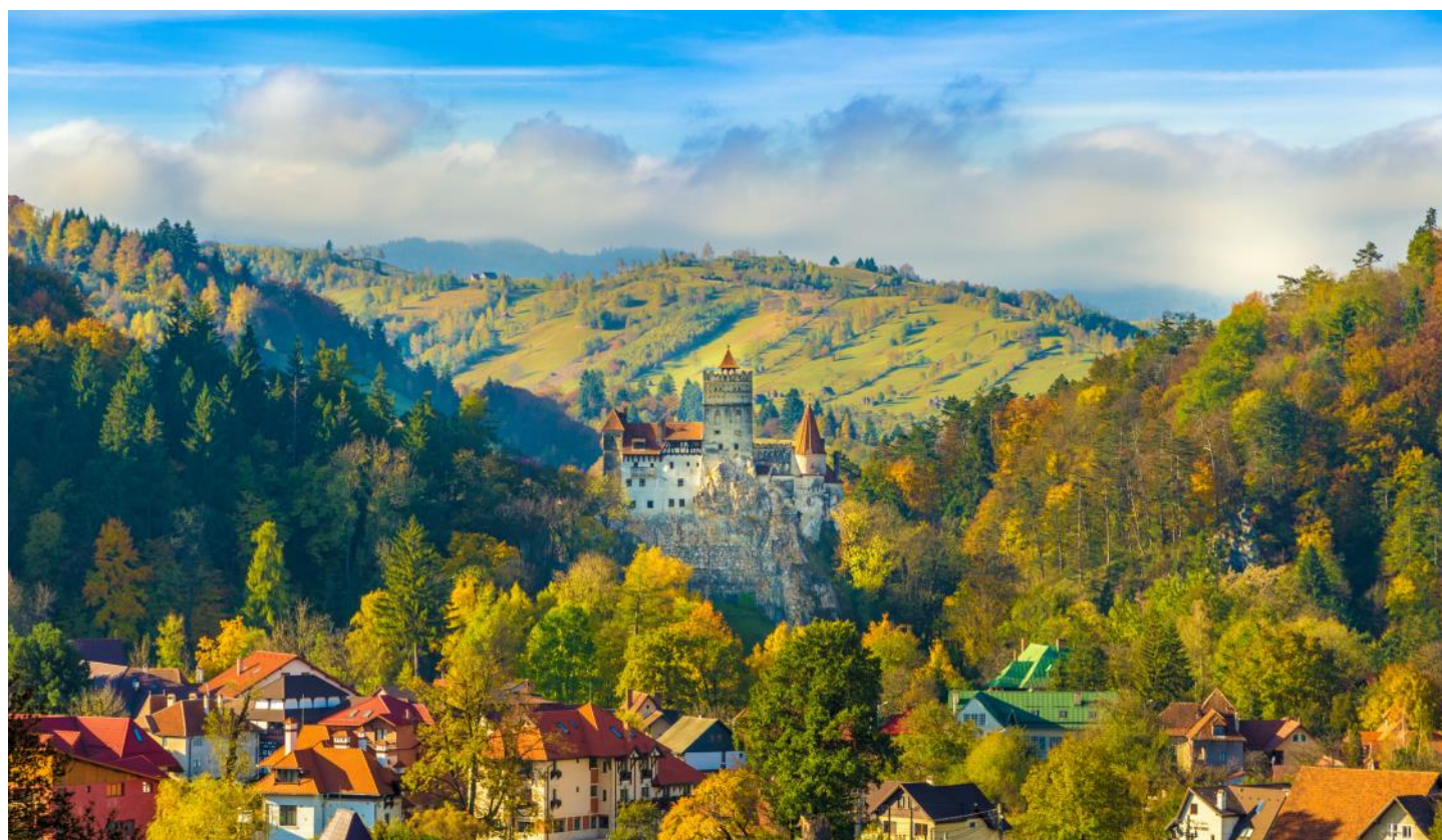
Vue sur le château Dracula de Bran

Le programme reste sous réserve de modifications !