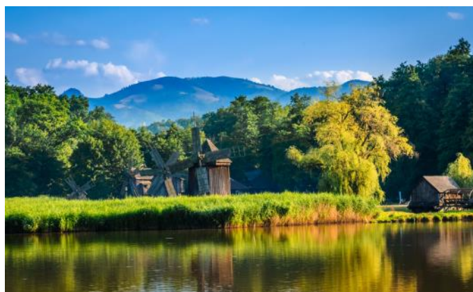
Le musée en pleine air de Sibiu