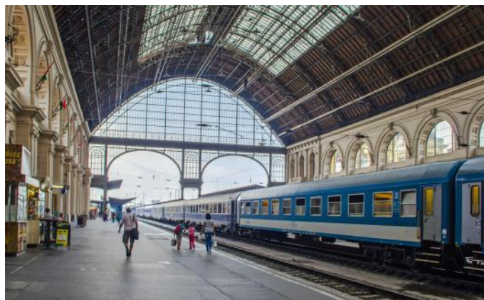
Le train pour la Roumanie en gare de Budapest-Keleti

Après la transition du socialisme, la vieille ville de Sibiu a été rénovée de manière exemplaire et est devenue en 2007 la capitale européenne de la culture. Avec ses trois places de la vieille ville faisant partie de la zone piétonne, Sibiu est sans doute la plus belle ville de Roumanie. Sibiu a été fondée au milieu du 12 ème siècle par des colons allemands sous le nom de Hermannstadt, ce qui est encore visible aujourd'hui. Nous visitons les curiosités à pied. Le grand et le petit place, l'église paroissiale protestante, différents musées intéressants et le marché valent le détour. L'après-midi, nous visitons le musée en plein air Astra, qui se trouve