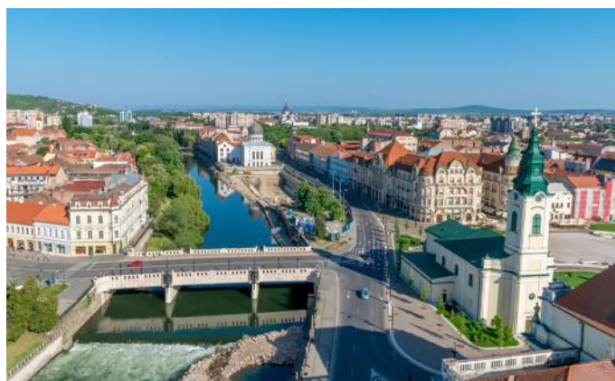
La ville d'Oradea

Pour le voyage de retour, nous prenons le train de nuit de Vienne à Zurich. Le voyage s'effectue dans des compartiments Double (2 lits superposés). Les personnes seules peuvent réserver un compartiment Single (compartiment à disposition exclusive) contre un supplément. Il est également possible d'effectuer le voyage de retour en train de jour.