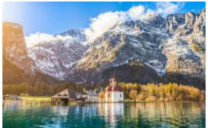
Königssee en automne