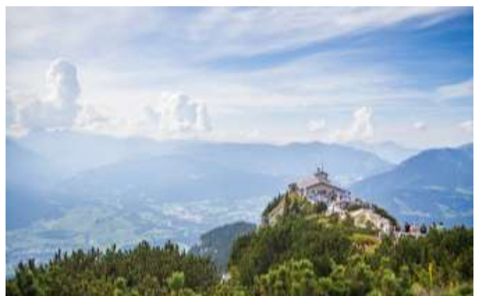
Kehlsteinhaus «Eagles Nest»