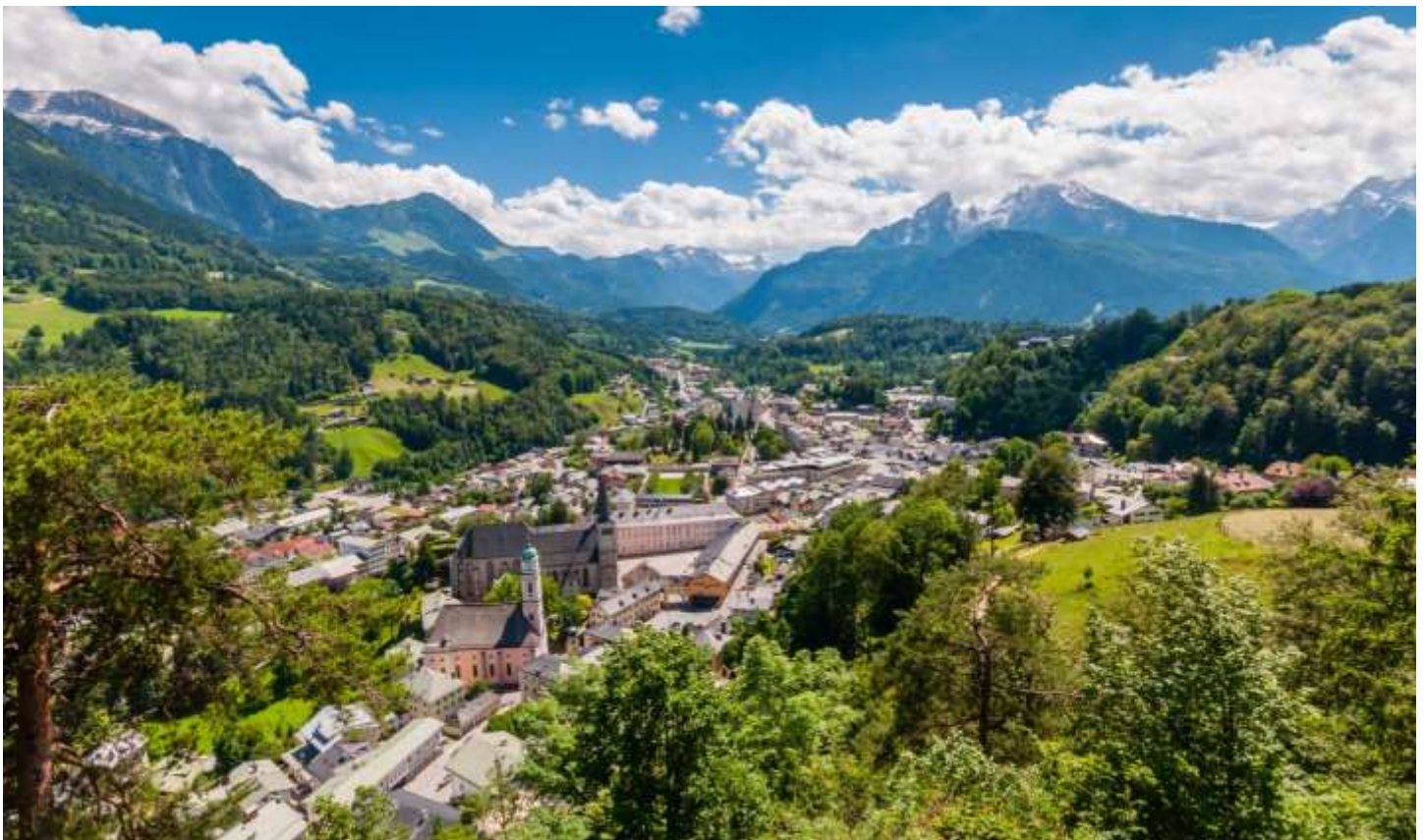
Berchtesgaden avec Watzmann