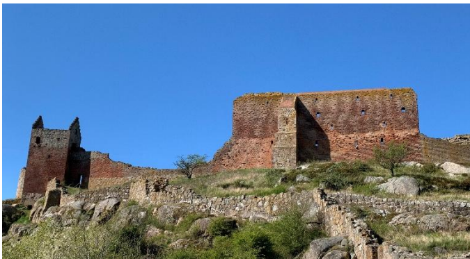
Die Schlossruine Hammershus auf Bornholm

Schweizer- und EU Bürger benötigen für die Reise einen gültigen Reisepass oder Identitätskarte.