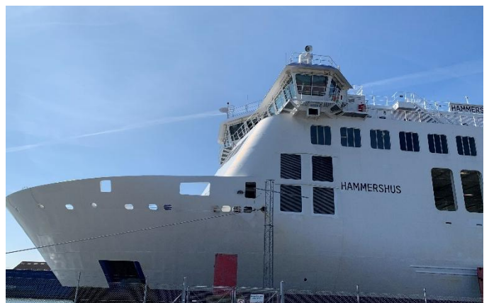
Fähre nach Bornholm - Hammershus