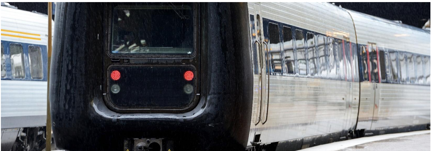
Intercity der Dänischen Staatsbahn (DSB)

Der IC3 der Danske Statsbaner ist ein dänischer Diesel-InterCity-Triebzug, der seit den 1990er-Jahren im Einsatz ist. Er ist besonders auffällig durch seine charakteristische Gummiwulst-Nase an der Front, die es ermöglicht, mehrere Einheiten miteinander zu kuppeln und direkt durchgängig zu verbinden. Hinweis: Vermutlich werden wir mit einem elektrischen Zug fahren. Die «Gummi-Nase» verschwinden, da der ursprüngliche Zweck getrennt auf die Fähren zu fahren, mit der Grossen Beltbrücke nicht mehr nötig ist.