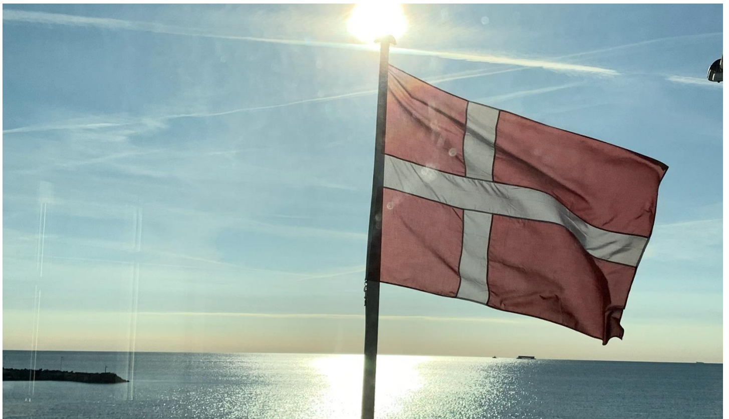
Viel Meer und Sonne