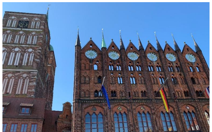
Rathaus von Stralsund