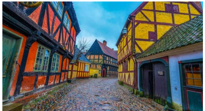
«Ballenberg» von Aarhus – De Gamle By