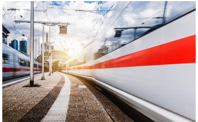
ICE4 in Frankfurt

Mittagessen in einem Restaurant auf Samsø, Nachtessen in Aarhus.