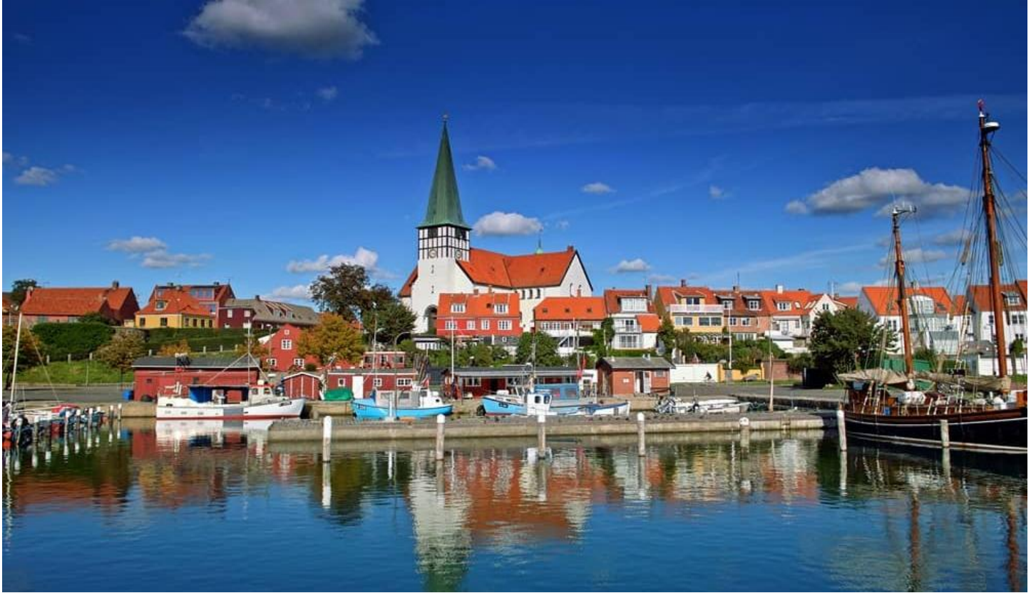
Hauptort Rønne auf Bornholm