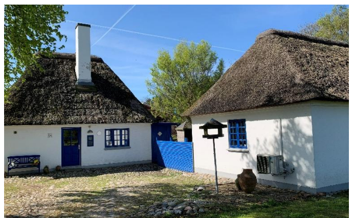
Strohdachhäuser auf Samsø