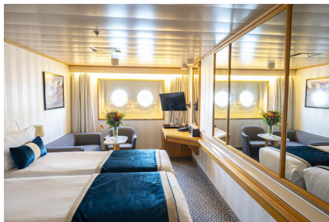
Cabine sur le pont 3