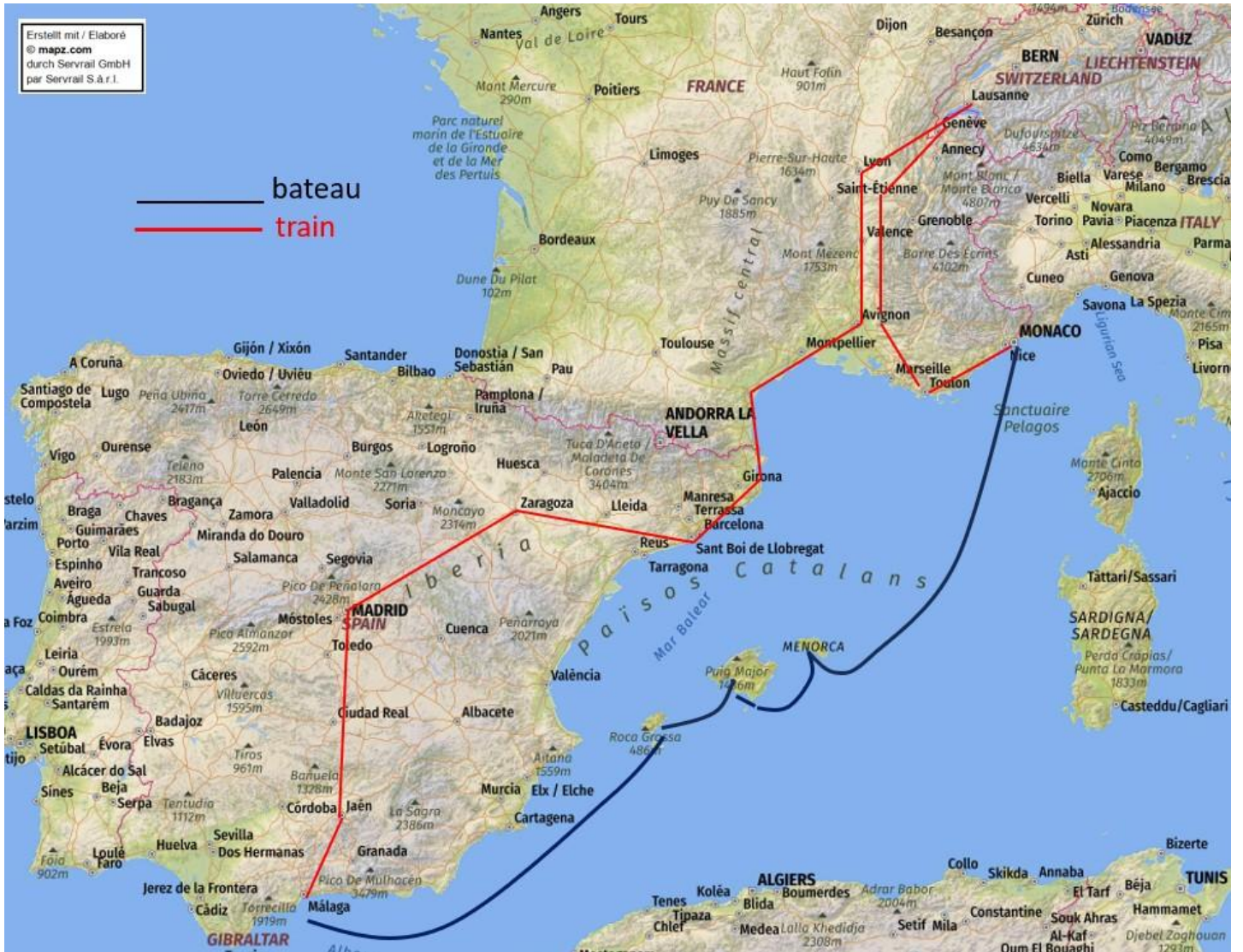
Train Suisse – Malaga – croisière – Baléares (Ibiza/Majorque/Minorque) – Nice – train – Suisse