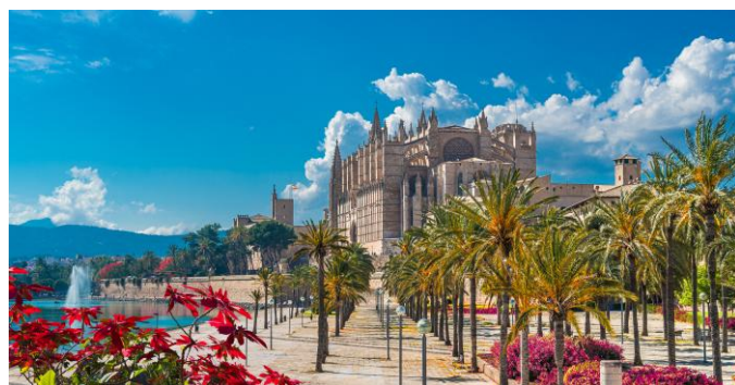
Cathédrale de Palma de Majorque