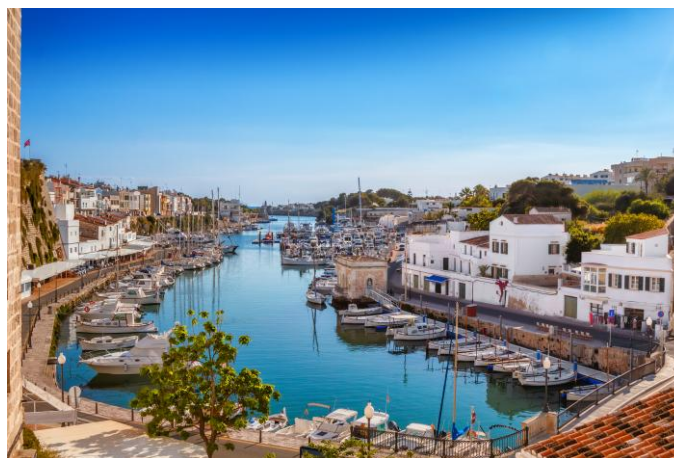
Un des plus beaux ports naturels de la Méditerranée