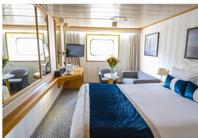
Cabine sur le pont 4