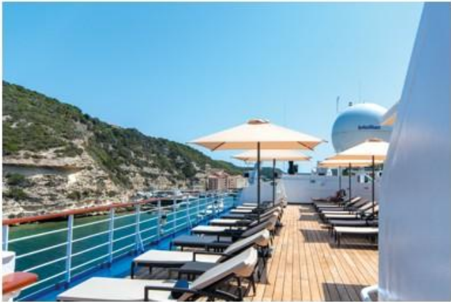
MV Belle des Océans avec restaurant au pont 3, la piscine avec bar et le pont soleil