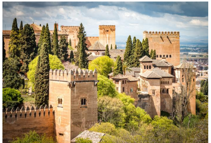
Alhambra à Grenade