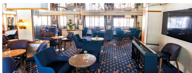
Salon sur le pont 4