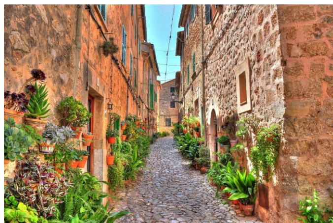
Ruelle à Valldemossa