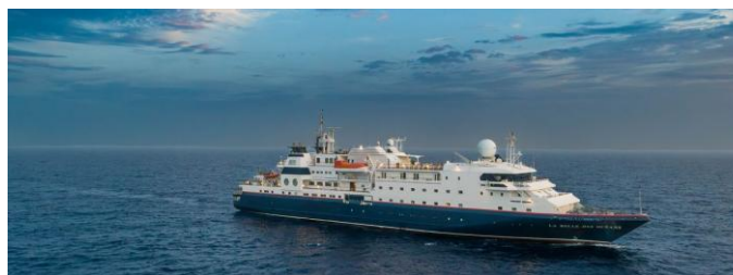
En navigation vers Nice