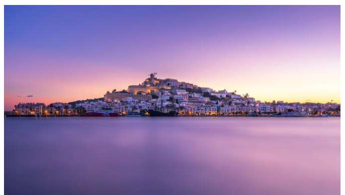
La vieille ville d'Ibiza au coucher de soleil