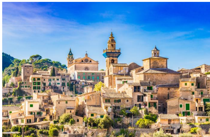
Valldemossa sur l'île de Majorque

Journée en navigation sur la mer Méditerranée. Savourez la sérénité d'une promenade sur le pont, d'un moment de lecture ou du ballet des vagues. L'après-midi invite à la contemplation, entre dauphins jouant dans le sillage de LA BELLE DES OCEANS et conférence passionnante. En fin de journée, admirez le spectacle du coucher de soleil qui teinte l'horizon de couleurs magiques. Soirée de gala.