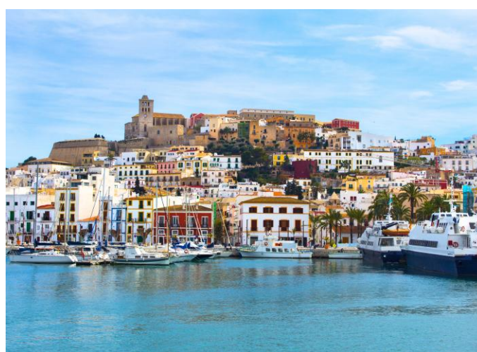
Le port d'Ibiza