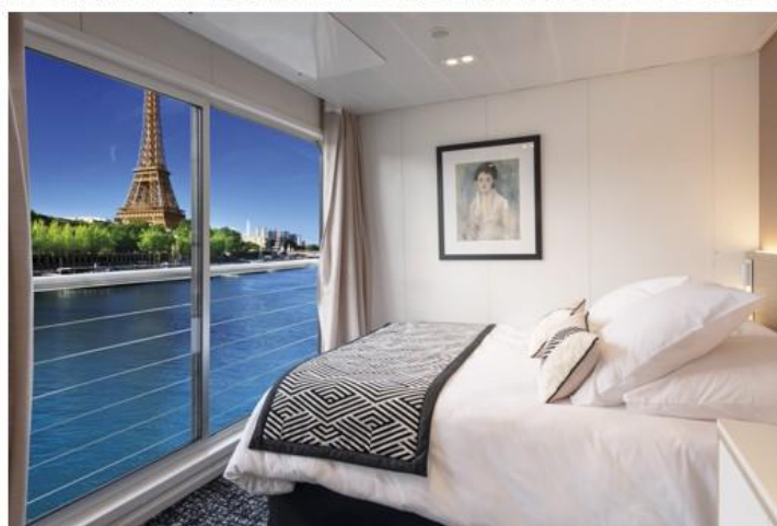
Cabines pont principal et supérieur, Restaurant et salon/bar