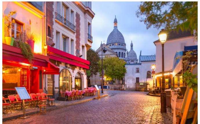
Paris - Montmartre

Petit déjeuner buffet. En matinée, excursion optionnelle : Tour panoramique de Paris . Vous apercevrez les monuments les plus emblématiques de la capitale, tels la Bastille, le quartier latin, le Louvre ou encore les Champs Elysées, l'Arc de Triomphe, la Tour Eiffel... Considérée comme la plus belle capitale du monde, Paris est un éblouissement de chaque instant. Déjeuner à bord. Après-midi libre à Paris. Profitez-en pour découvrir la capitale à votre rythme ou excursion optionnelle : Le château de Versailles (uniquement sur pré-réserve avant le départ). Il compte parmi les plus célèbres et prestigieux monuments de l'Art français du XVIIe siècle. "Ce n'est pas un palais, c'est une ville entière. Superbe en sa grandeur, superbe en sa matière", écrivait Charles Perrault au sujet de ce splendide monument historique, classé au patrimoine mondial de l'humanité. De la Galerie des glaces aux appartements du Roi, du Domaine du Trianon aux sublimes jardins, chaque pas est une aventure et tout n'est que merveille. Dîner et soirée animée.