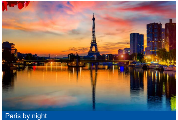
Paris by night

Arrivée individuelle à Genève ou à Lausanne. Genève départ à 12 :29 – Paris Gare de Lyon arrivée à 15 :42 ou Lausanne départ à 12 :19 – Paris Gare de Lyon arrivée à 16 :04. Transfert en autocar vers la gare fluviale. Embarquement, présentation de l'équipage et cocktail de bienvenue. Navigation dans Paris "by night" avec une magnifique navigation au cœur de la plus prestigieuse capitale du monde. Parés de leurs superbes habits de lumière, les plus beaux monuments de Paris se succèdent au fil de l'eau. Un spectacle féérique. Dîner et bateau à quai.