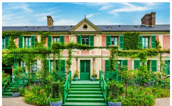
Fondation Claude Monet