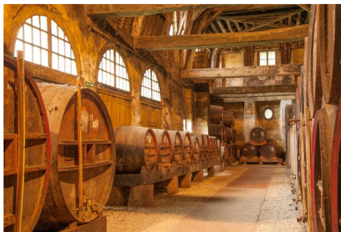
Distillerie de Calvados