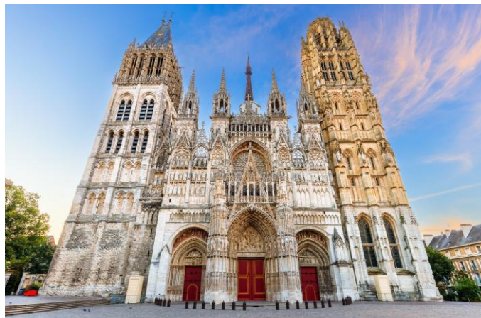
Rouen - Cathédrale