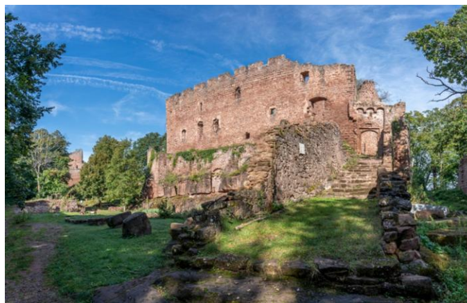
Schlossruinen von Lützelburg