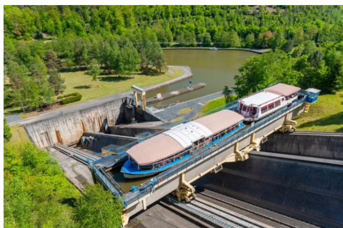
Schiffshebewerk von Arzviller