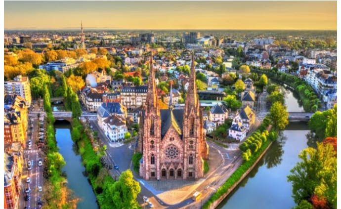
Strassburg – Kathedrale Notre-Dame

Vormittags, Fahrt auf dem Rhein-Marne Kanal bis nach Waltenheim an der Zorn. Der 1853 in Betrieb genommene Kanal wurde gleichzeitig mit der Eisenbahnlinie Paris-Straßburg gebaut. Nach der Abfahrt in Straßburg fahren Sie durch die elsässische Ebene bis zum Zorn-Tal. Am Nachmittag, Ausflug in die hügelige Region Kochersberg. Die Region, die früher als „Kornkammer“ von Straßburg bezeichnet wurde, birgt wahre Schätze. Felder soweit das Auge reicht, große Bauernhöfe und nicht zu vergessen die typischen Fachwerkhäuser. In Truchtersheim besuchen Sie das Haus des Kochersberg. Dieses Museum für Volkskunst und Traditionen würdigt das lokale Erbe, seine Bräuche und Traditionen, seine alten und zeitgenössischen Objekte in ständig wechselnden Ausstellungen. Anschließend Weiterfahrt nach Hochfelden zur Besichtigung der Villa Meteor. Die älteste Brauerei Frankreichs öffnet Ihnen die Türen ihres Museums. Ein Ort von hohem kulturellem Wert, an dem Sie alle Schritte und Werkzeuge der Herstellung des Meteor-Biers entdecken können, von alten Maschinen bis hin zu neuen Technologien. Bierverskostung am Ende des Besuchs.