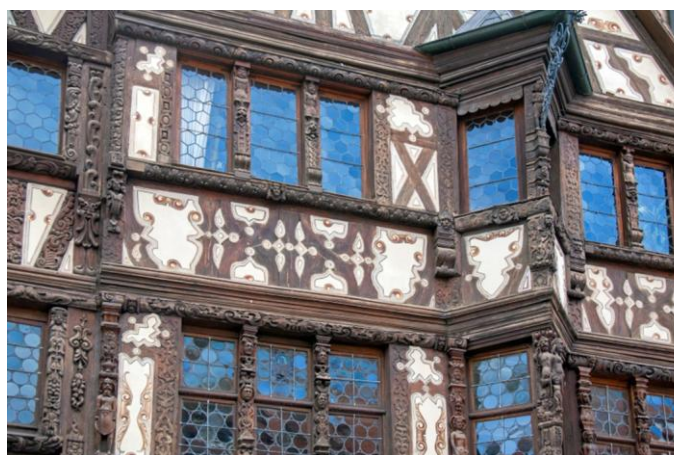
Zabern (Saverne) – Katz Haus