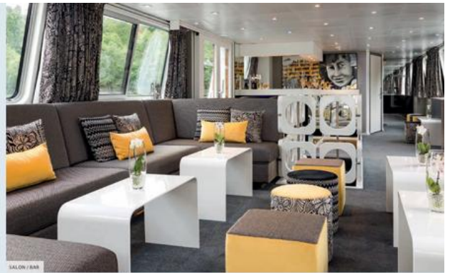
SALON / BAR

■ Cabine PMR ® , 11 m 2 ■ Cabine double, 9 m 2