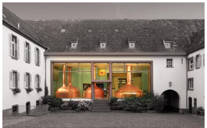
Villa Meteor - Hochfelden