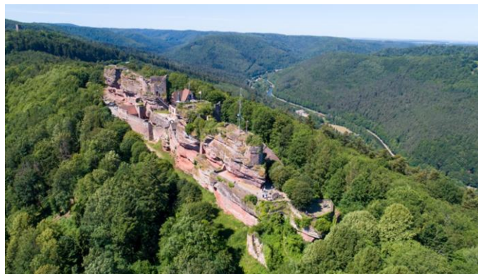
Burgruine von Haut-Barr

Sie machen einen Zwischenstopp in der Kristallfabrik. Die seit 25 Jahren neben dem Schiffshebewerk von Arzviller gelegene Kristallfabrik lässt Sie die Geheimnisse des Glasblasens entdecken. Sie können den Handwerkern zusehen, die Ihnen eine Vorführung des Glasblasens und -schleifens geben.