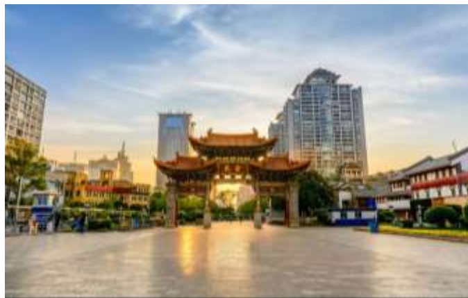
« Jinbi square » à Kunming

Les citoyens suisses et européens ont besoin d'un passeport ou d'une carte d'identité en cours de validité pour ce voyage.