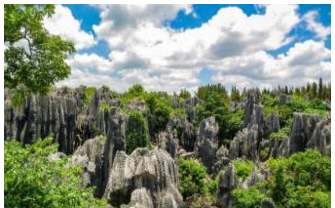
La forêt de pierres noires