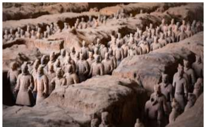
Armée de terre cuite