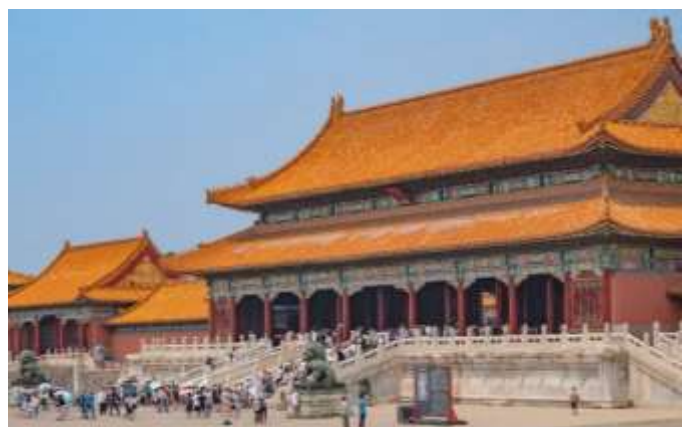
La Cité interdite