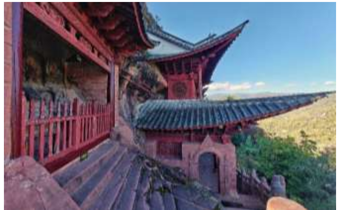
Temple de Shibashan

Visite de la célèbre armée de terre cuite de l'empereur Qin Shi Huang, l'un des trésors historiques les plus précieux de Chine. Ces soldats, chevaux et chars en argile, grandeur nature et sculptés individuellement, représentent un patrimoine vieux de 2 200 ans. Découverts en 1974, ils sont inscrits au patrimoine mondial de l'UNESCO. Participez ensuite à un atelier de calligraphie.