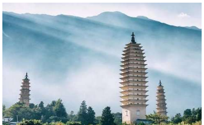
Le temple des pagodes à Dali