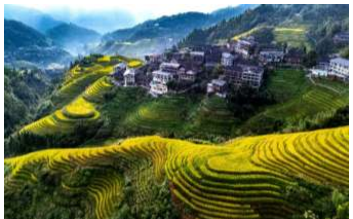
Rizières de Longsheng