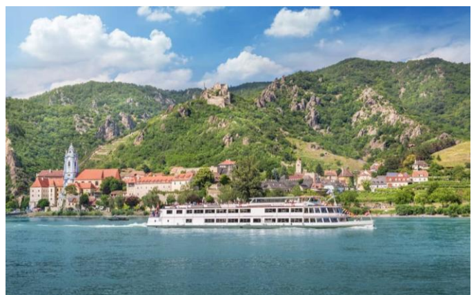
Schiffahrt auf der Donau