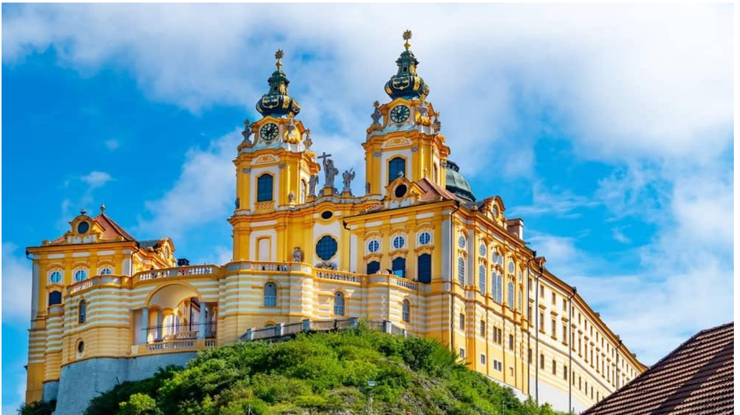
Stift Melk an der Donau