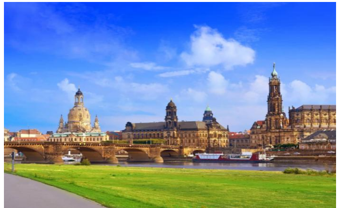
Dresde, sur l'Elbe

Sous réserve de modifications d'horaires et d'échanges entre les jours d'excursion.