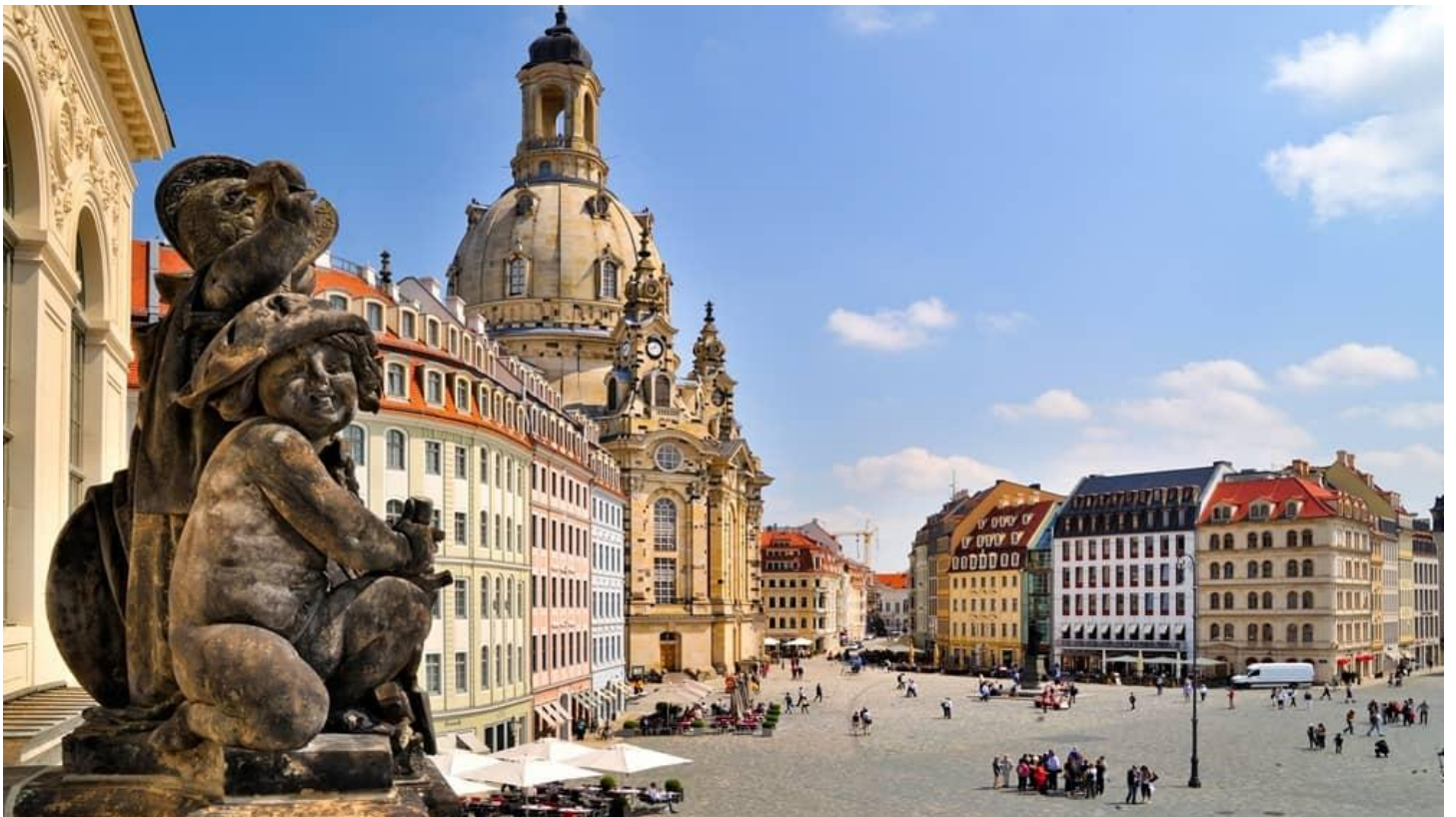
Sculpture sur le parapet du Musée des transports