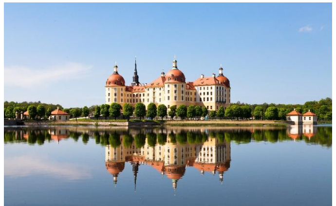
Château de Moritzburg