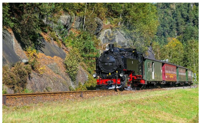
Chemin de fer à voie étroite de Zittau