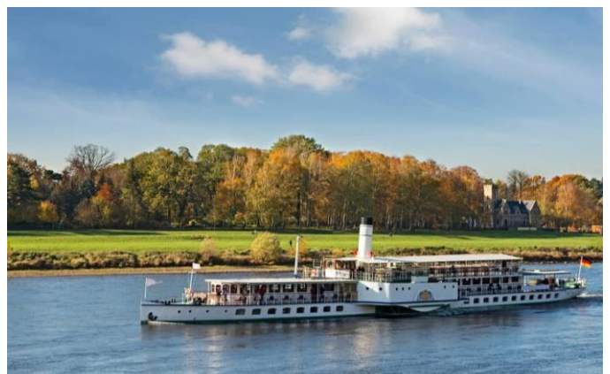
Bateau à vapeur sur l'Elbe