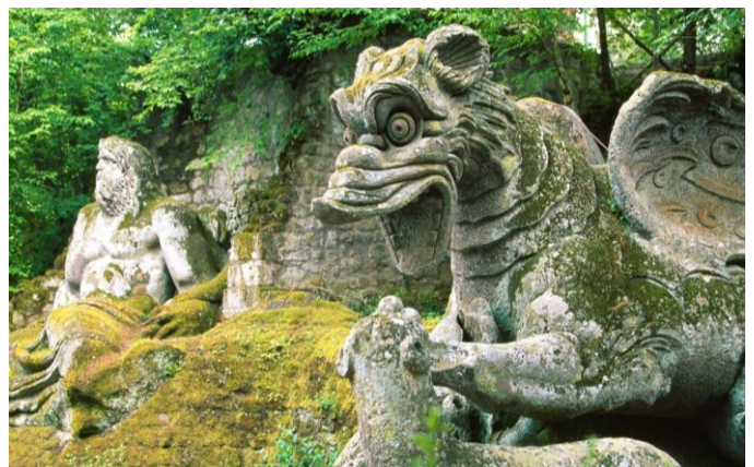
Jardin des monstres