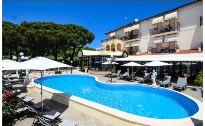
Hôtel Le Naiadi, Bolsena

Dîner de clôture dans un très bon restaurant.