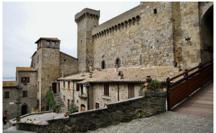
Castello di Bolsena