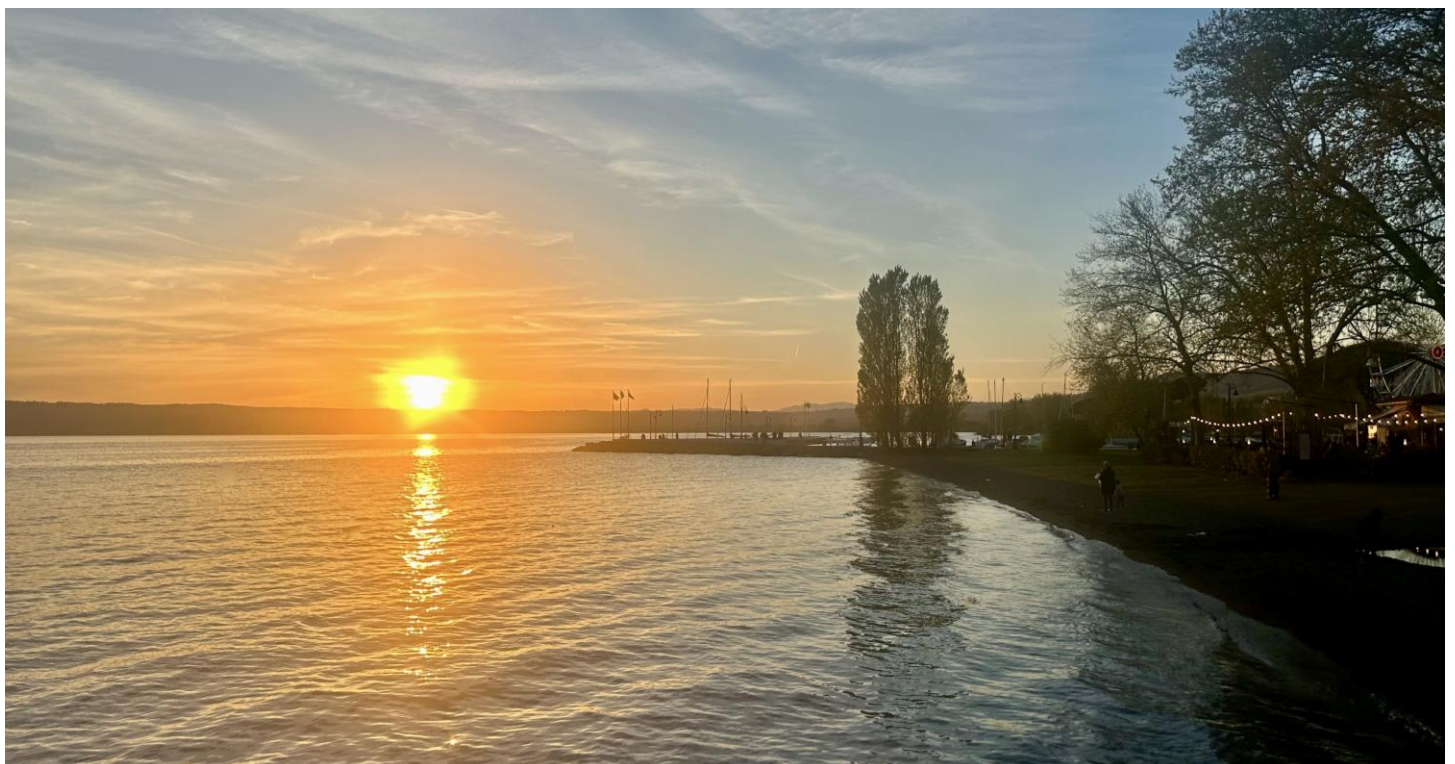
Sonnenuntergang am Lago di Bolsena