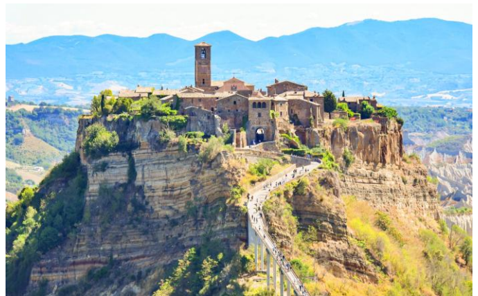
Bagnoregio – die sterbende Stadt