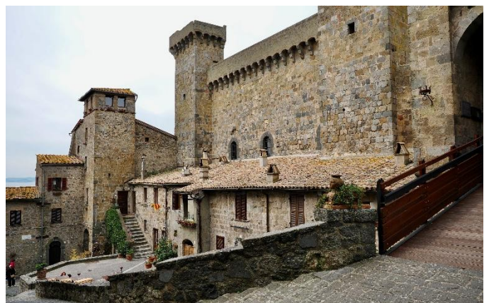
Castello di Bolsena