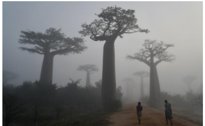
Sonnenaufgang an der Baobab-Allee

Abendessen und Unterkunft für eine Nacht.