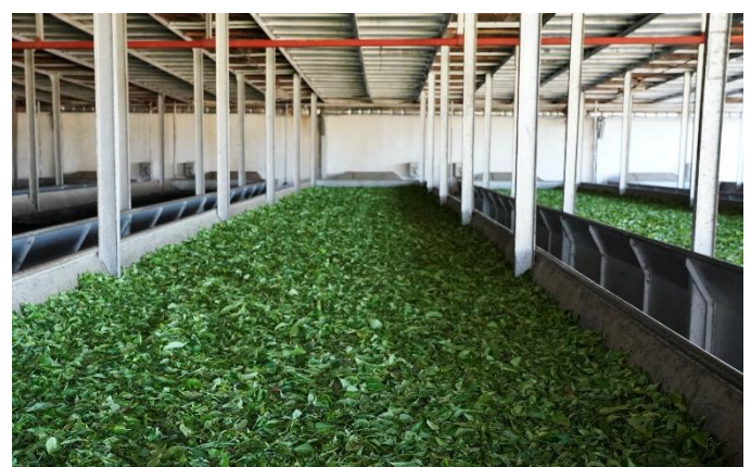
Teefabrik in Sahambavy