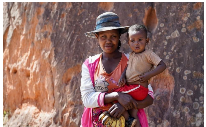
Madegassin mit Kind