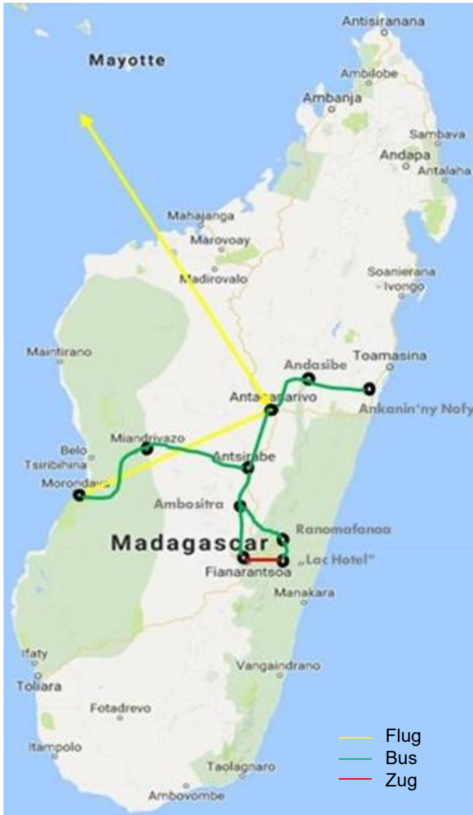
Unsere Reiseroute in Madagaskar