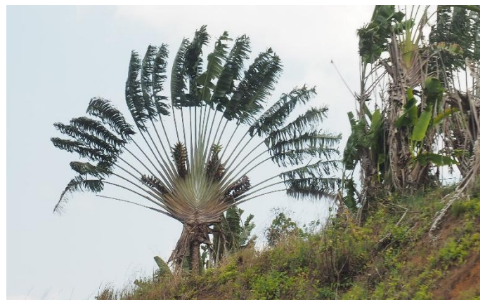
Baum des Wanderers