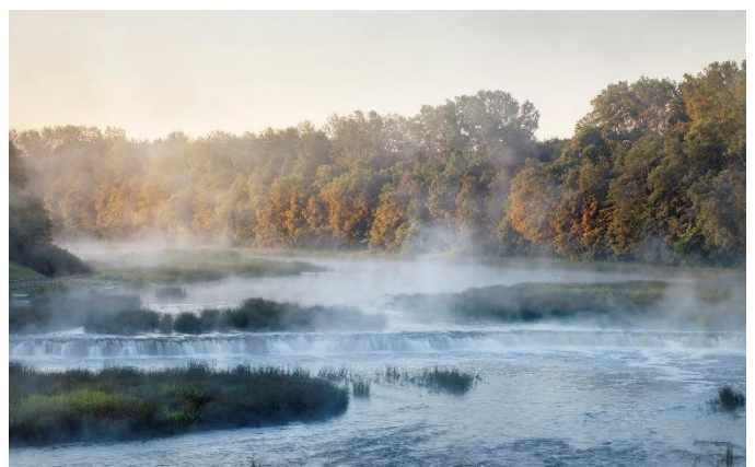
Chute d'eau de Kuldīga