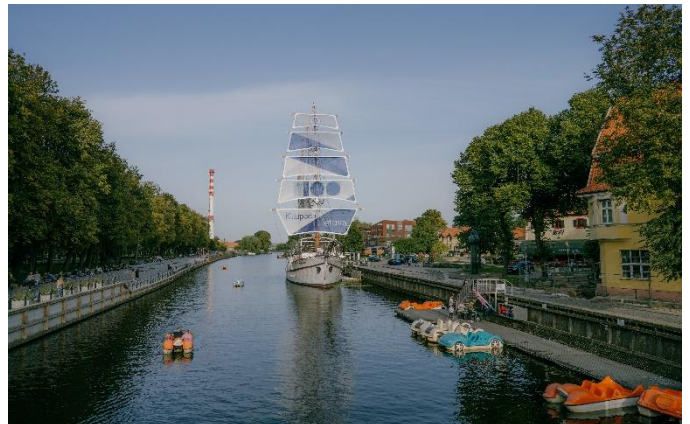
Vieille ville de Klaipeda