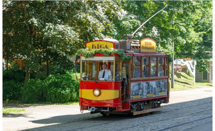
Voiture de tramway historique

Voyage en train jusqu'à Klaipeda. Une promenade dans la ville permet de découvrir de nombreuses curiosités. Que ce soit la place du théâtre avec l'Ännchen von Tharau, les