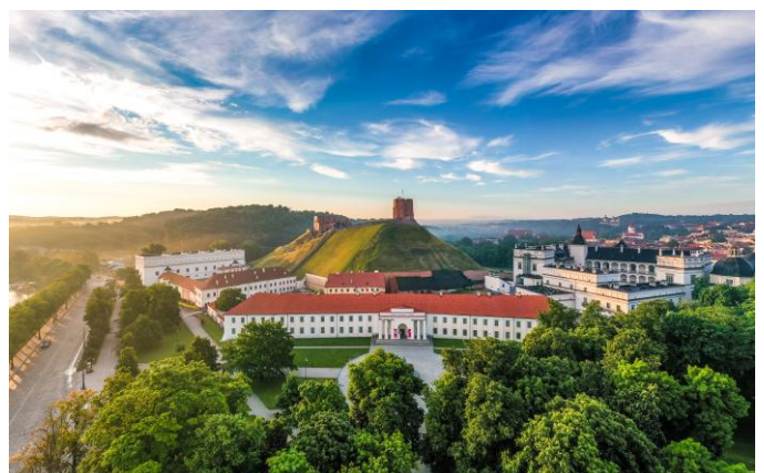
La tour de Gediminas