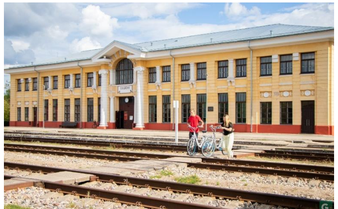
Gare de Gulbene