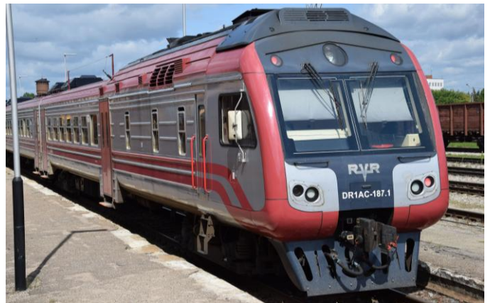
Train de banlieue à Riga