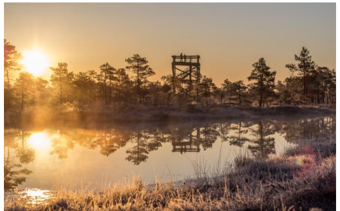
Parc national de Kemeru