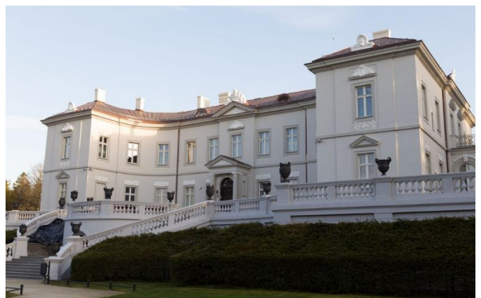
Musée de l'ambre