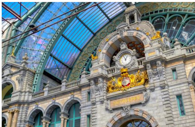
La gare ferroviaire d'Anvers

Matin --> Un tour panoramique vous donnera un aperçu des multiples richesses historiques et curiosités de la capitale néerlandaise. Moulins, diamantaires, ou encore le célèbre marché aux fleurs sont autant de symboles qui reflètent les Pays-Bas et leur histoire. Nous ferons un premier arrêt au moulin Riecker, un des plus vieux moulins d'Amsterdam situé sur la rive de l'Amstel. Nous poursuivrons en rendant visite à un diamantaire où vous découvrirez le travail de cette pierre précieuse ainsi que son histoire. Départ vers le marché aux fleurs où vous terminerez cette carte postale néerlandaise en découvrant de milliers de variétés de fleurs et de bulbes de tulipes, la fleur star du pays.