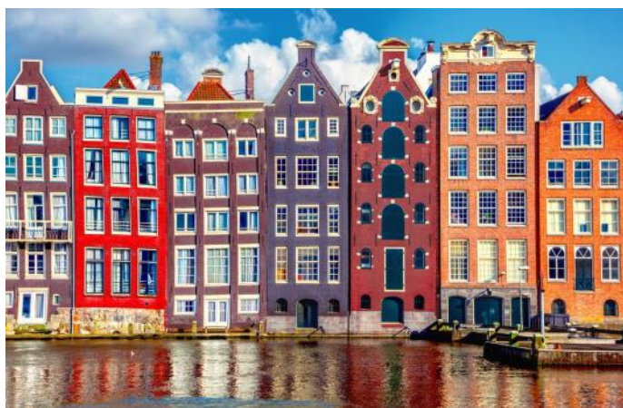
Maisons colorées dans la vieille ville d'Amsterdam

Le programme reste sous réserve de modifications !