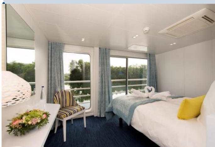
Cabine pont supérieur