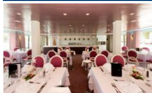
Restaurant du bateau