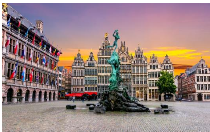
Anvers: Fontaine Brabo sur la place du marché