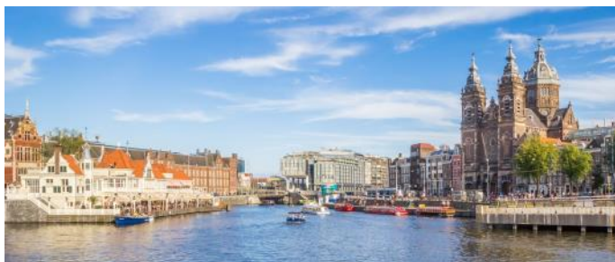
Amsterdam avec l'église Saint Nicolas