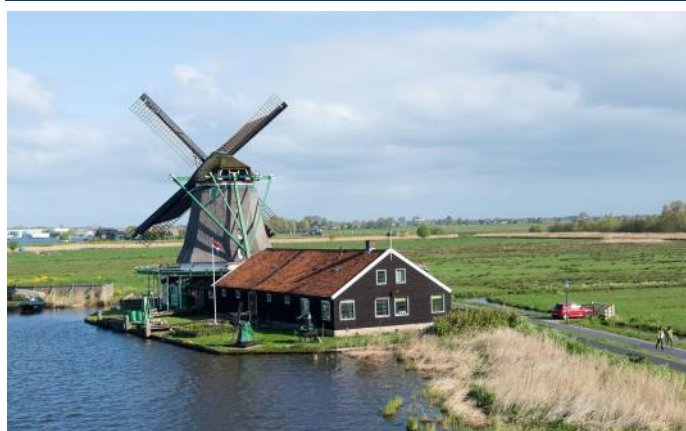
Promenade à Zaanse Schans