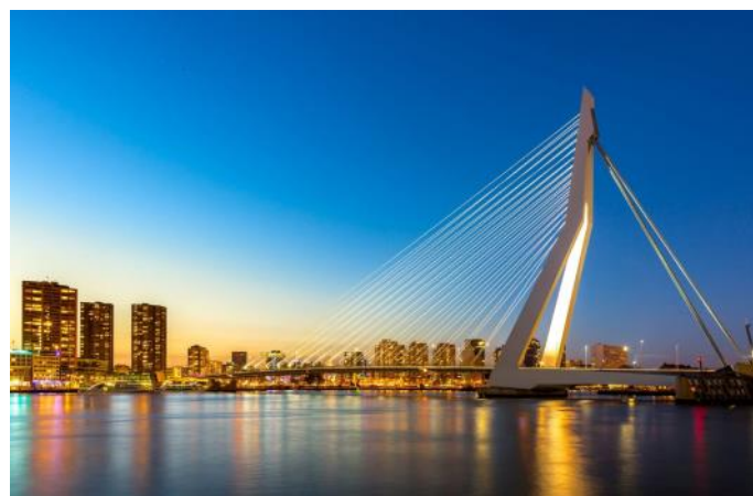
Pont d'Erasmus à Rotterdam