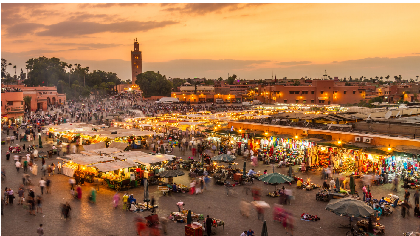
Der berühmte Markt in Marrakesch !