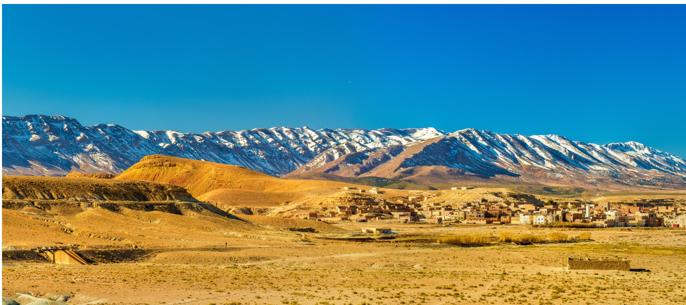
Oase Midelt im Hohen Atlas

Carfahrt entlang fruchtbaren Kulturlandschaften nach Oualidia, ein lauschiger Ferienort an einer idyllischen Lagune. Nach dem Mittagessen erwartet uns eine atemberaubend schöne Küstenfahrt entlang einsamer Strände und imposanter Felsenrieffs. Gegen Abend erreichen wir Essaouira, die Künstlerstadt oder Stadt des Windes. Abendessen und Unterkunft in Essaouira.