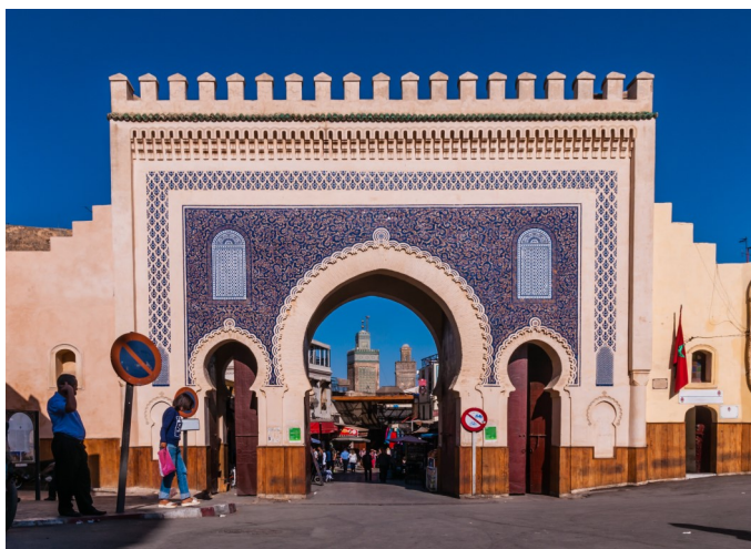
Eingang zur Medina in Fès

Am Vormittag geführte Stadtbesichtigung. Die Stadt ist voll lebhaftem Treiben. In den Souks wird das traditionelle Handwerk noch immer gepflegt und man kann den Färbern und Lederhandwerkern bei ihrer Arbeit zusehen. Mittagessen in einem traditionellen Restaurant in der Altstadt. Am Nachmittag Zeit zur freien Verfügung.