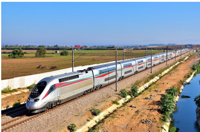
Mit dem TGV von Tanger nach Rabat

Am Vormittag erwartet uns eine interessante Bahnfahrt mit dem TGV über die Neubaustrecke. Eine abwechslungsreiche Fahrt durch sandige Landstriche, weite Kulturlandschaften und durch den Mamorawald (Korkeichen) nach Rabat, der Hauptstadt Marokkos am Atlantik. Am Nachmittag Besichtigung der Hauptstadt mit dem Königspalast, Hassan Turm, das Mausoleum Mohammed V und die verspielte Kasbah des Oudaia. Abendessen und Unterkunft in Rabat.