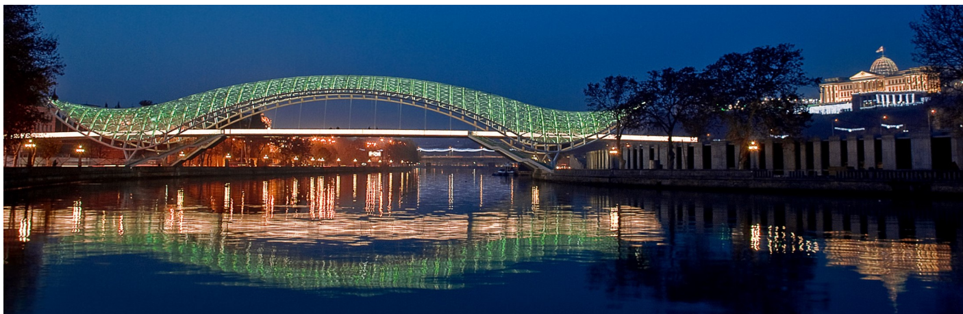
Tbilissi - Brücke des Friedens

Les citoyens suisses et européens ont besoin d'un passeport valide pour entrer, qui est encore valable 6 mois après la date du voyage.