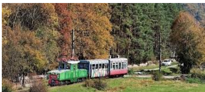
Train spécial Kukushka - Bakuriani

Traversée de la "Svanétie - la couronne du Caucase" jusqu'à Mestia. Visite de la ville, puis montée en téléphérique sur le mont Hatsvali, d'où l'on peut admirer le panorama montagneux. Logement pour deux nuits.