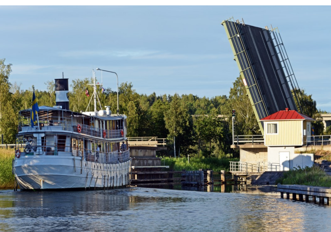
L'écluse est ouverte - passage libre !