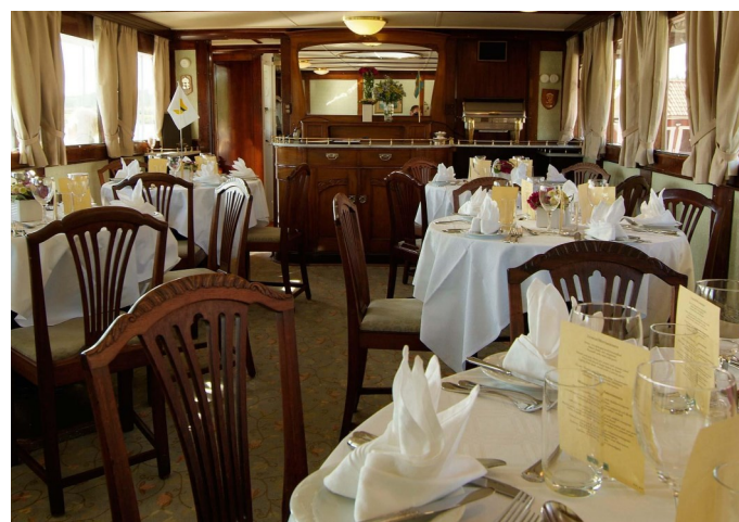
La salle à manger M/S Juno

Le M/S Juno étant un bateau historique, les cabines ne sont pas équipées de salles de bain privées, des toilettes et des douches se trouvent sur tous les ponts.