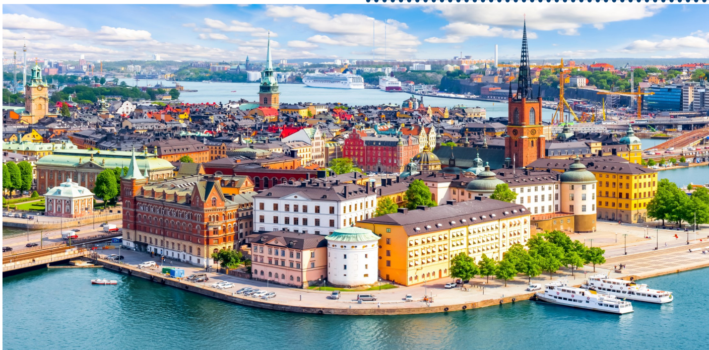
Stockholm - une ville à savourer !