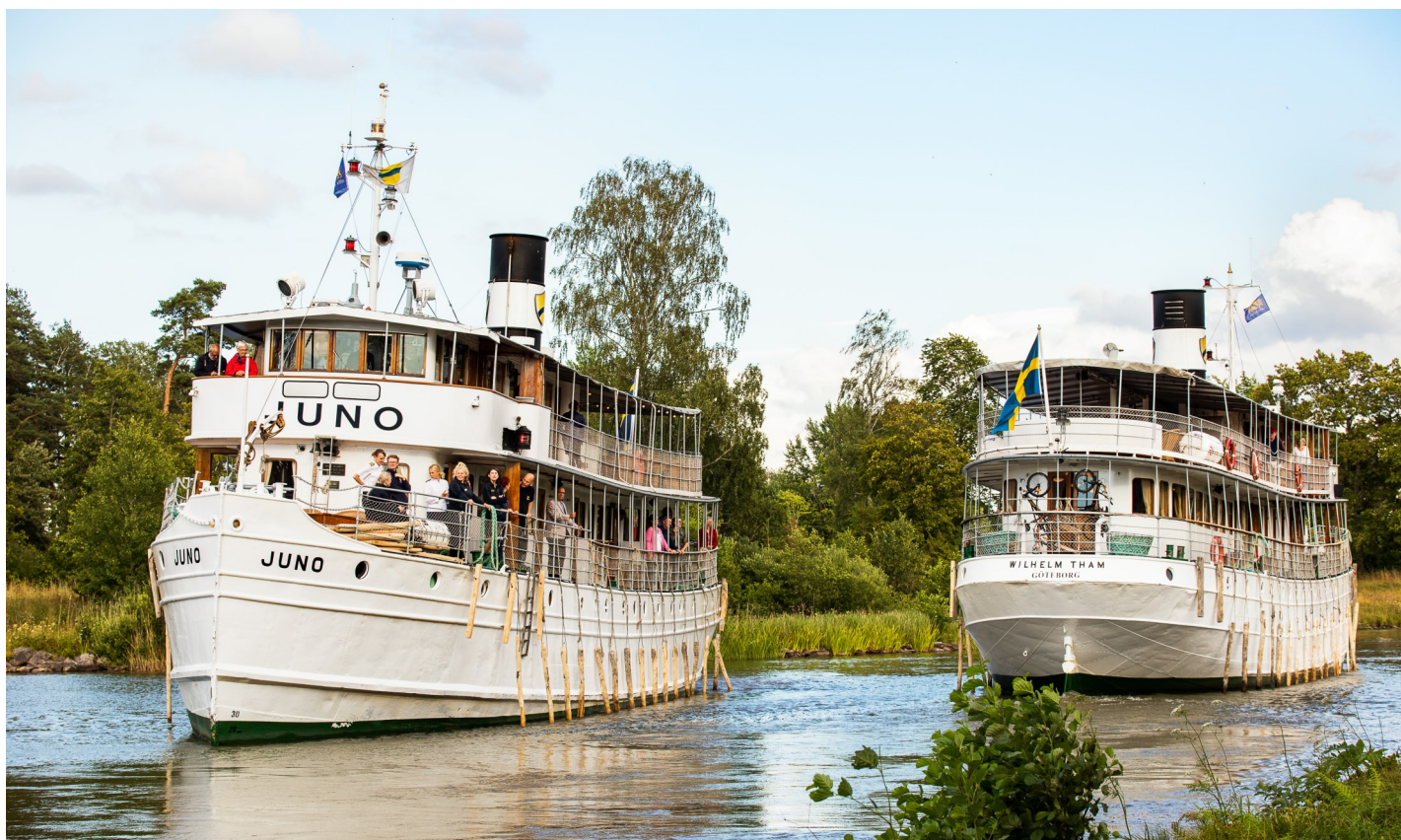
Une rencontre intéressante dans le canal de Göta