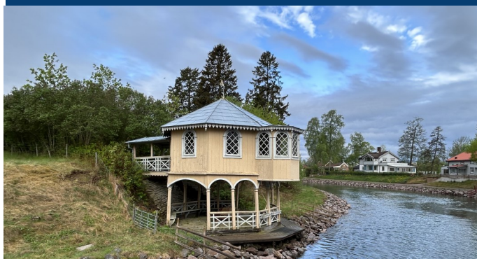
Il n'y a pas que des écluses dans le canal de Göta !