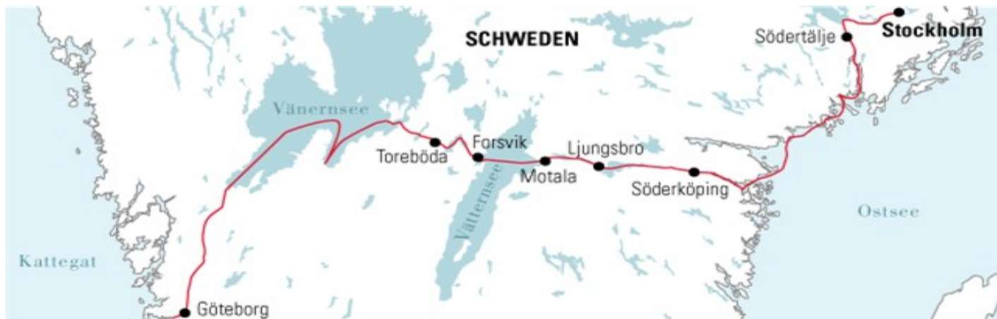
L'itinéraire de M/S Juno de Göteborg à Stockholm

Aujourd'hui, c'est une attraction touristique qui fonctionne du 1er mai au 27 septembre et attire un grand nombre de touristes du monde entier. Des bateaux de plaisance et des péniches opèrent sur le canal.