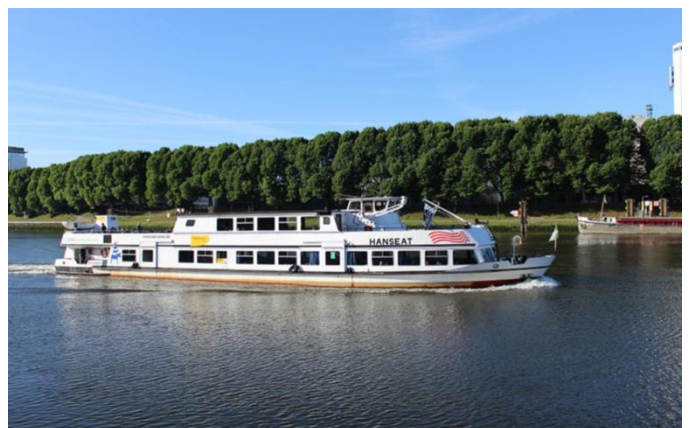
Sur la Weser vers Brême