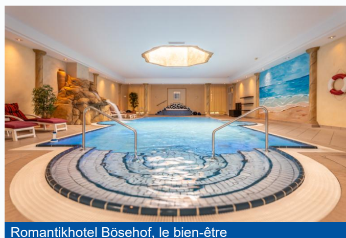
Romantikhotel Bösehof, le bien-être