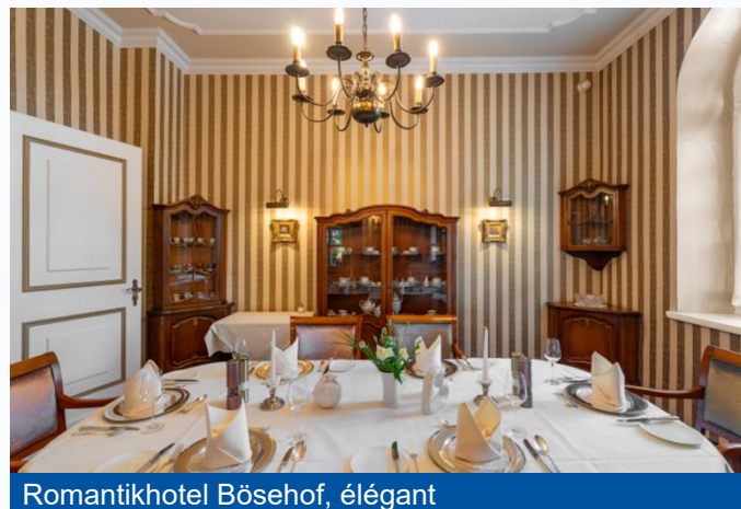
Romantikhotel Bösehof, élégant