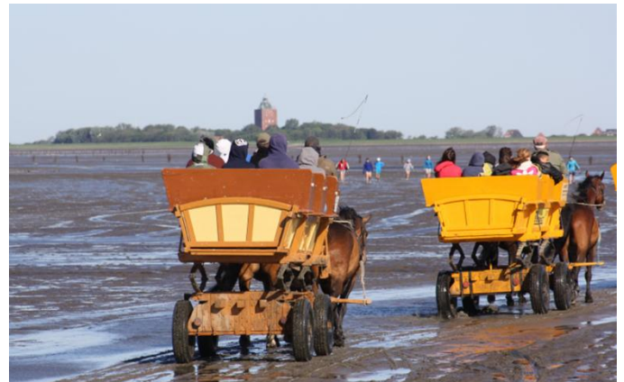
En calèche sur l'île de Neuwerk

Sous réserve d'un échange entre les journées d'excursion. Les excursions dans la mer des Wadden