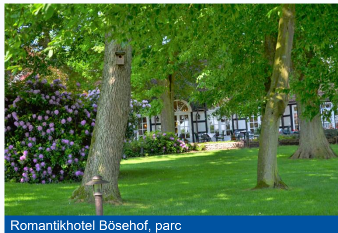
Romantikhotel Bösehof, parc

du 28 au 31 août 2027 Hôtel Bösehof à Bad Bederkesa