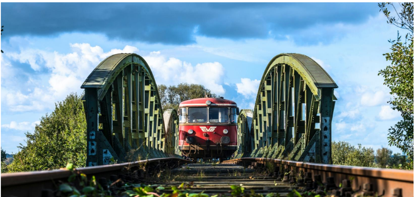
Le Moorexpress en route entre Brême et Stade