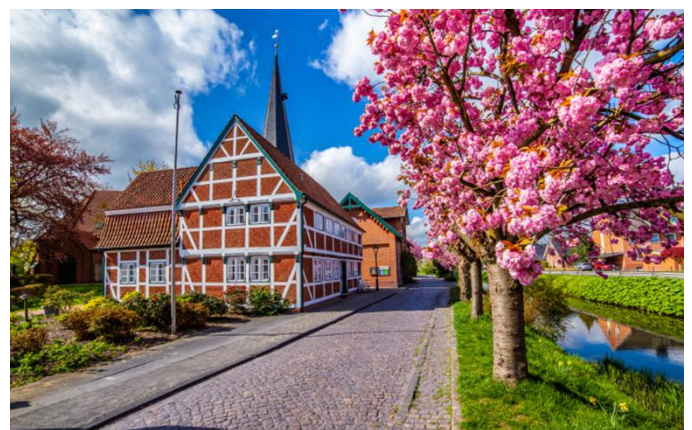
« Altes Land » (Le Vieux Pays)