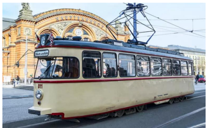
Brême, tramway historique