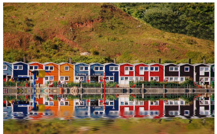
Helgoland, les baraques à homards colorées