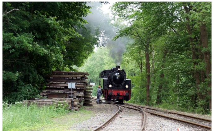
Le train à vapeur « Jan Harpstedt »