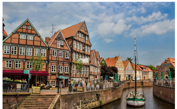
Vieille ville de Stade