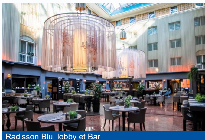
Radisson Blu, lobby et Bar