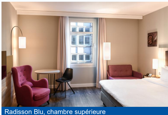
Radisson Blu, chambre supérieure