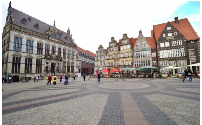
Brême, place du marché

En deux heures et demie, le wagon Moorexpress parcourt les 99 kilomètres qui traversent le Teufelsmoor de Brême à Stade en passant par Osterholz-Scharmbeck, Worpsswede, Gnarrenburg et Bremervörde. À un rythme tranquille, il passe par des prairies, des champs et des fossés. Après une courte visite de la vieille ville historique de la ville hanséatique de Stade, nous découvrons l'Altes Land lors d'une visite guidée, un paysage culturel créé par l'homme qui est unique en Allemagne. Il y a plus de 800 ans, les colons néerlandais ont rendu la région habitable et ont créé un paysage florissant. Grâce à leur connaissance de la construction de digues, ils ont protégé le sol