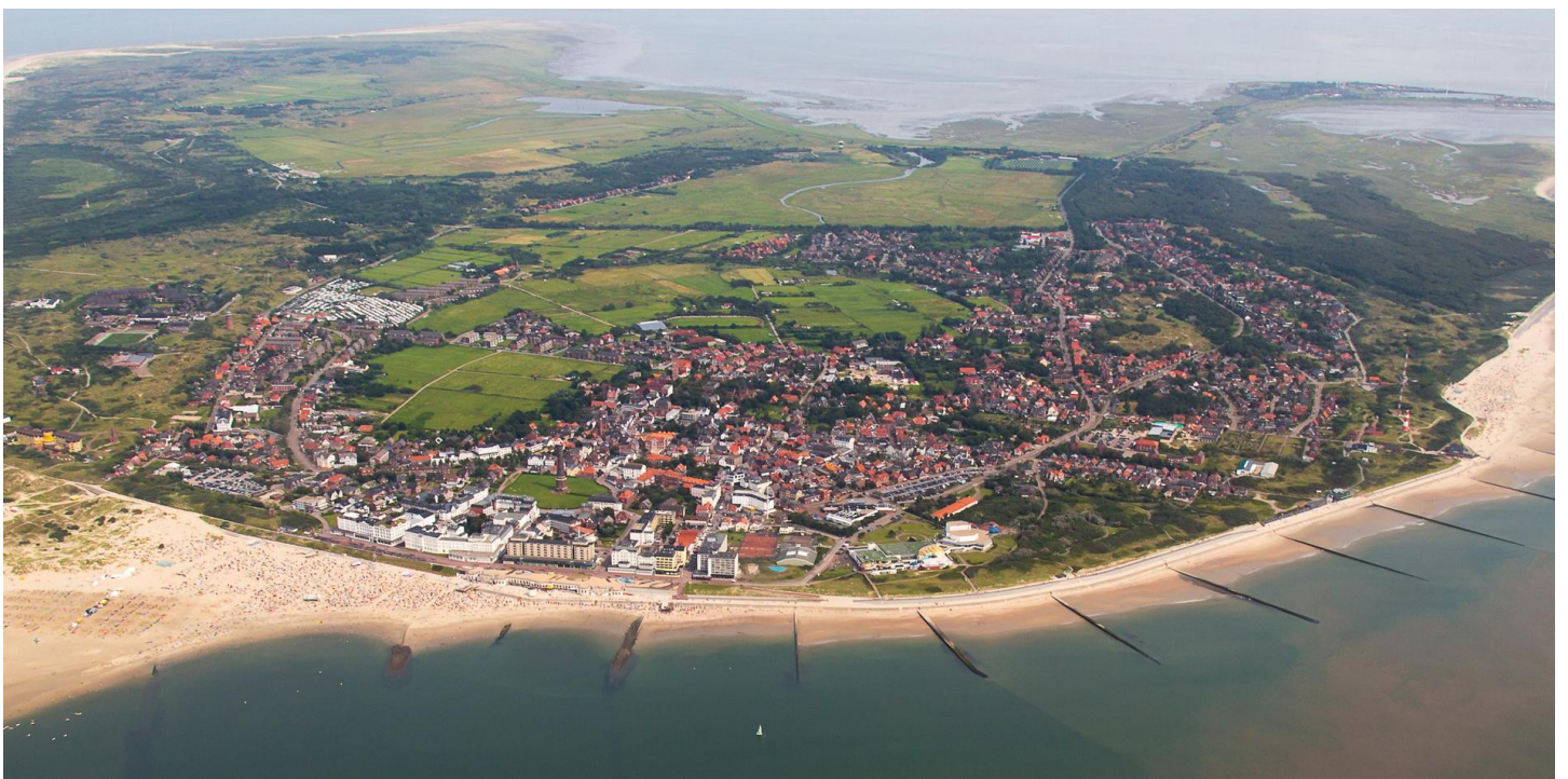
Insel Borkum, Luftaufnahme