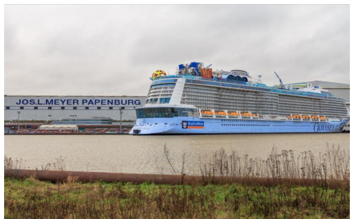
Meyer – Werft in Papenburg