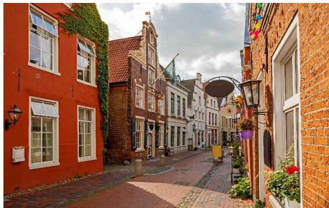
Altstadt von Leer