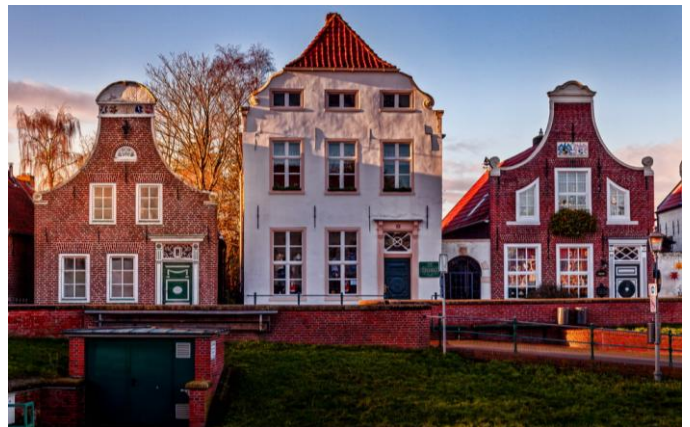
Häuser im Hafen von Greetsiel