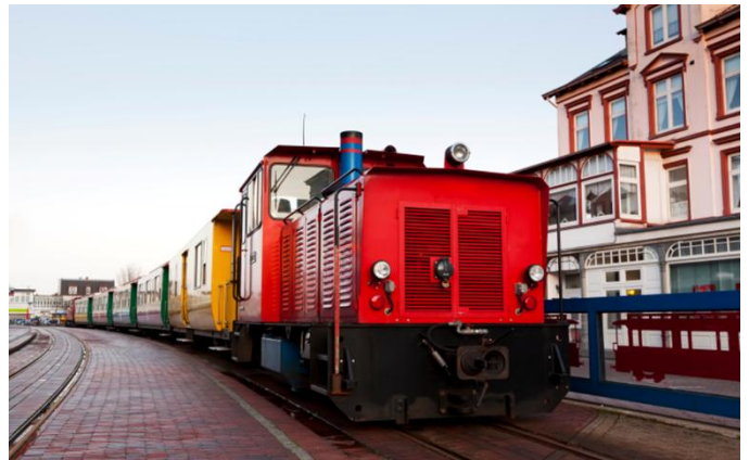
Kleinbahn am Hafen Borkum

Carfahrt nach Norden. Fahrt im Extrazug der Museumseisenbahn Küstenbahn Ostfriesland, kurz MKO, auf der 17 Kilometer langen Strecke zwischen Norden und Dornum.