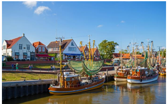
Im Hafen von Greetsiel