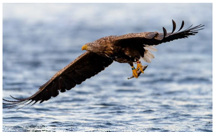
Seeadler auf den Lofoten