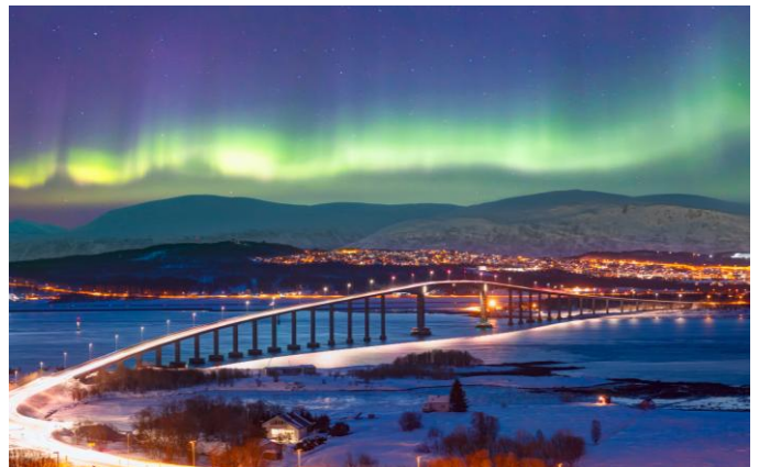
Nordlicht über Tromsø