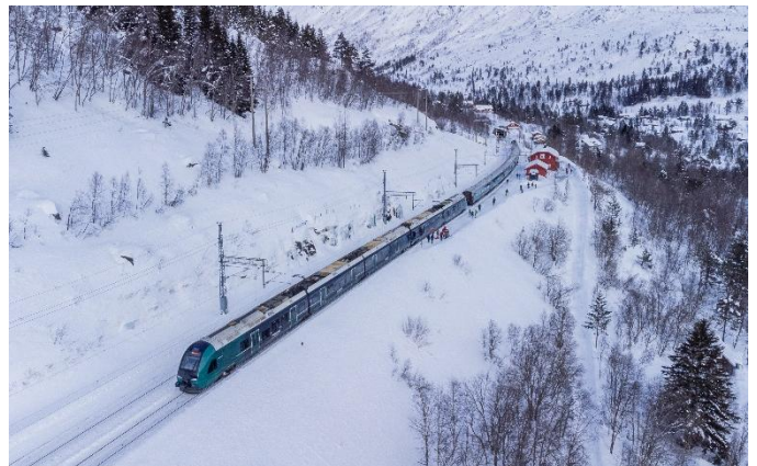
Legendäre Bergensbahn im Winter