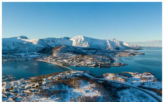
Stokmarknes – Gründungsort der Postschiff-Route