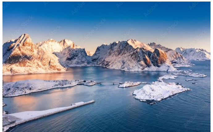
Winter auf den Lofoten

Früh am Morgen überqueren Sie den nördlichen Polarkreis. Die weitere Route wird geprägt von bildschönen Inseln und führt nach Bodö. Am Abend erreichen Sie die Inselgruppe der Lofoten mit ihren steil aus dem Meer emporragenden Bergen. Mit ihrer einzigartigen Landschaft und den pittoresken Fischerdörfern zählt die Inselgruppe zu einem beliebten Reiseziel. Aufenthalt in Svolvær.