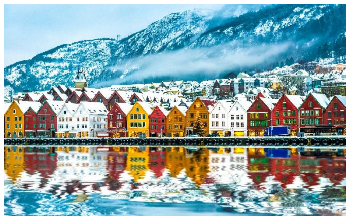
Holz Häuser im Hanse-Viertel in Bergen