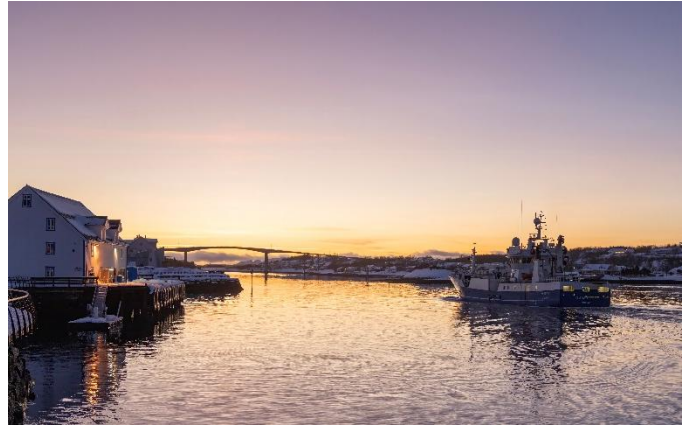
Norwegen lebt traditionell vom Fischfang

Am Morgen legt Ihr Schiff in der Universitätsstadt Trondheim an. Die bedeutendste Sehenswürdigkeit ist der Nidarosdom – das grösste religiöse Bauwerk Skandinaviens. Beliebte Fotomotive sind auch die farbenfrohen Speicherhäuser am Fluss Nidelv und die Brücke Bybrua. Nachmittags fährt ihr Postschiff vorbei am hübschen Leuchtturm von Kjeungskjaer und durch den schmalen Stokksund.