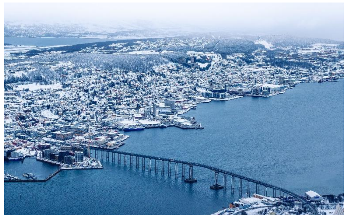
Tromsø ist das Tor zur Arktis

Am frühen Nachmittag erreichen Sie Tromsø und haben einen längeren Aufenthalt. Die Stadt wird auch «das Tor zum Eismeer» genannt. Im Polarmuseum werden ihnen die Polar-Expeditionen der Forscher Amundsen und Nansen nähergebracht. Sehr sehenswert ist die Eismeerkathedrale. Den Hausberg Storsteinen erreichen Sie mit einer Seilbahn. Die Aussicht auf Tromsø ist spektakulär. Zudem befindet sich hier die nördlichste Brauerei der Welt.