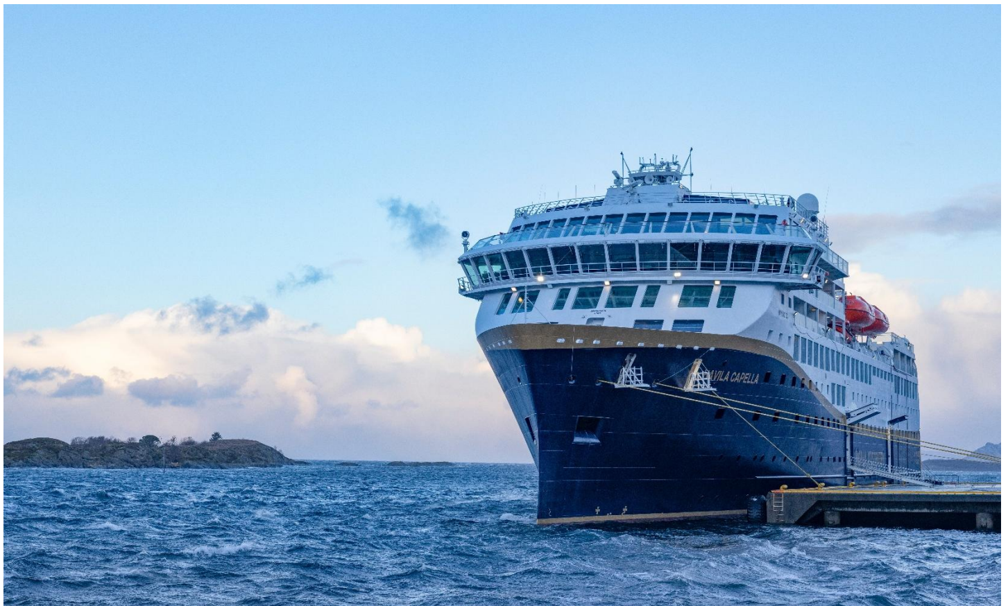
Die moderne Havila Capella fährt nachhaltig mit LNG und Landstrom

Die Kabine ist 15 m 2 gross und verfügt über ein Panoramafenster. Grosser Kleiderschrank. TV. Schreibtisch. Eigenes Bad mit Dusche.