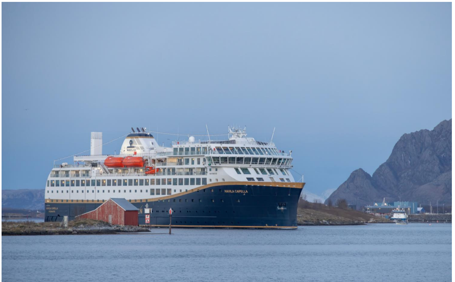
Die Havila Capella – Ihr Postschiff

Während dieser Reise sind Sie zweimal mit einer modernen, komfortablen Fähre der Color Line unterwegs. Sie fahren am 2. Tag die Strecke Kiel-Oslo nordwärts und am 16. Tag die Strecke Oslo-Kiel südwärts. Beide Male geniessen Sie eine entspannte Fährpassage über Nacht. Nicht fehlen darf das beliebte Buffet zum Abendessen mit seinen nordischen Spezialitäten.