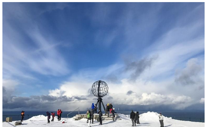
Nordkap im Winter

Die Ausblicke auf die Küste werden dramatischer und sie erreichen kurz nach dem Frühstück Kirkenes. Die Grenzstadt besitzt einige kleine Museen, die eine reiche Geschichte und das Erbe dieser Region näherbringen. Jetzt fährt das Schiff wieder zurück nach Süden. Genießen Sie die Aussicht auf die arktische Landschaft von Deck oder von der Panorama-Lounge aus.