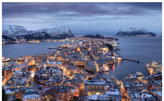
Die Stadt Alesund liegt an einer einmaligen Lage