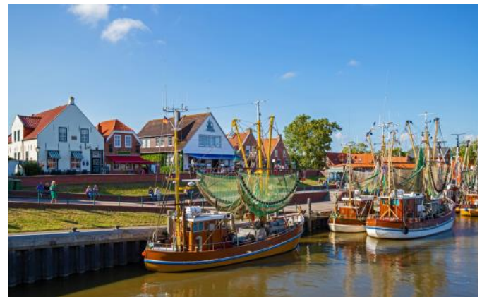
Im Hafen von Greetsiel

Das schmucke Fischerdorf Greetsiel, an der ostfriesischen Nordseeküste gelegen, ist bekannt für seinen Hafen mit den feinen Fischrestaurants, den traditionellen Fischerbooten und den Backsteinhäusern aus dem 18. Jahrhundert. Wir entdecken das historische Zentrum auf einem Stadtrundgang und genießen die Ruhe Ostfrieslands auf einer gemütlichen Bootsfahrt, die durch das Naturschutzgebiet Leyhörn bis zur Schleuse von Leysiel geht.