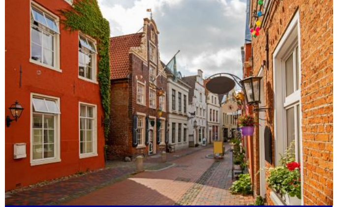
Altstadt von Leer