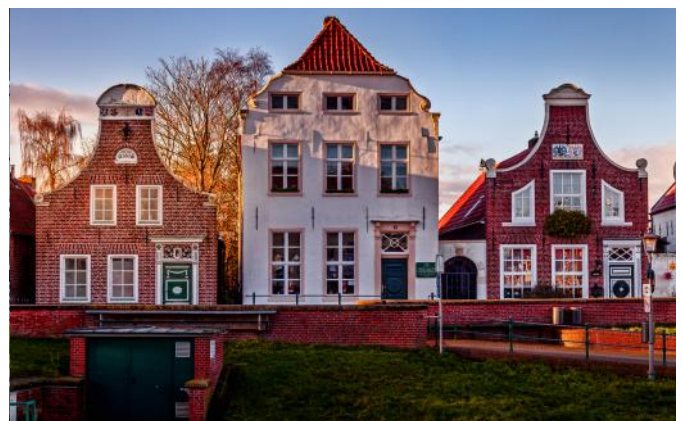
Häuser im Hafen von Greetsiel

Ein Austausch der Ausflugstage untereinander bleibt vorbehalten.