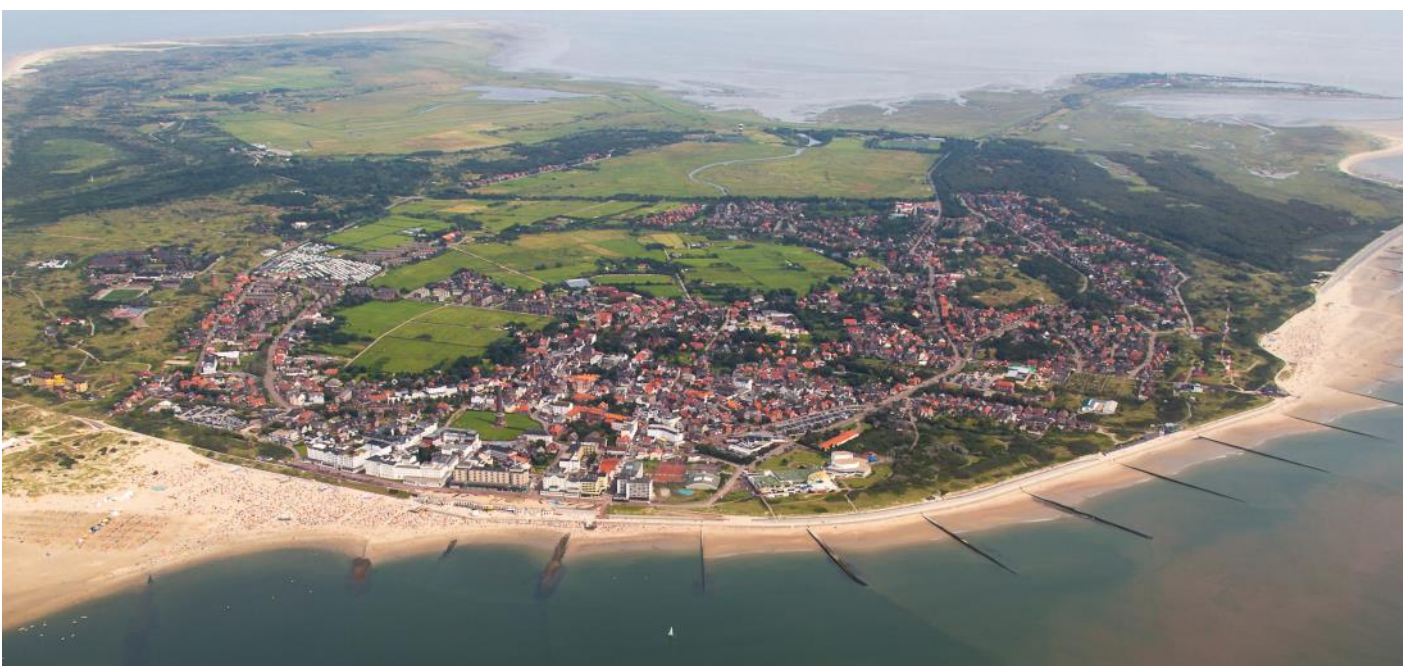
Insel Borkum, Luftaufnahme