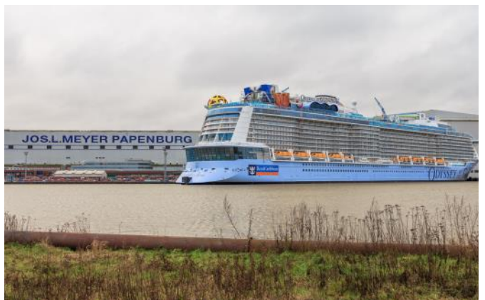
Meyer - Werft in Papenburg