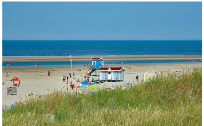
Strand von Langeoog