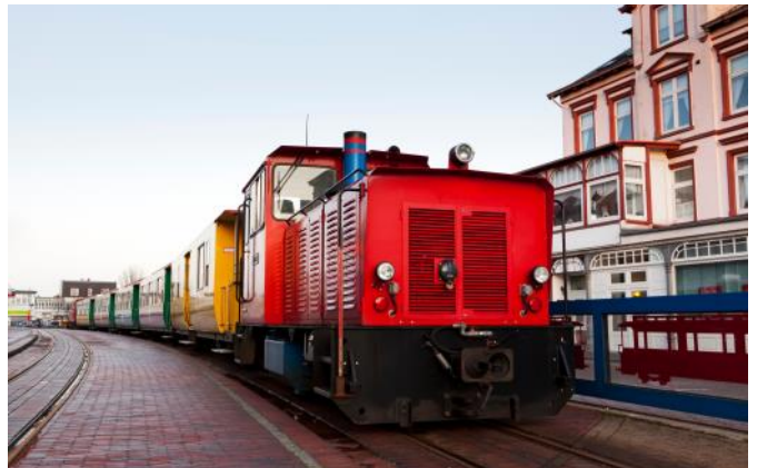
Kleinbahn am Hafen Borkum

Die Meyer-Werft ist eine der modernsten Werften der Welt. Wir tauchen ein in die Welt der Ozeanriesen und lassen uns die Produktion von den Fachleuten vor Ort erklären. Im Besucherzentrum erhalten wir durch die Exponate, Filme, einer Musterkabine usw. einen tiefen Einblick in den Produktionsprozess der Werft und den Glamour einer Kreuzfahrt. Am Nachmittag besuchen wir auf einem Stadtrundgang die romantische Altstadt von Leer. Dicht beieinander finden sich in den historischen Bürgerhäusern originelle kleine Geschäfte sowie ein großes Angebot an Restaurants und Cafés.