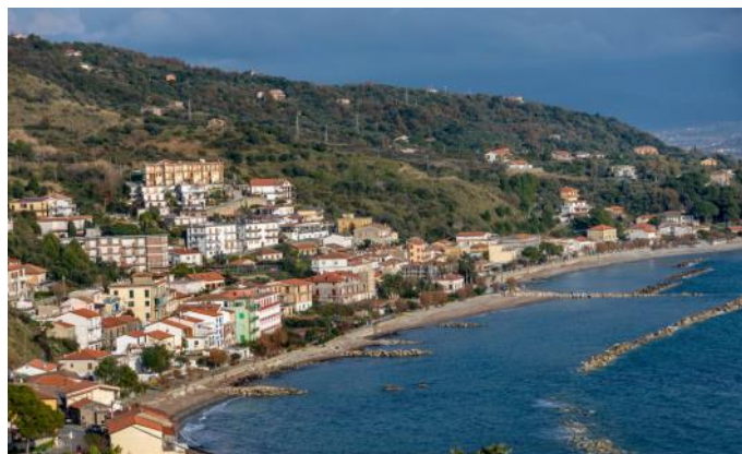
Le village de Pioppi

Nous longeons la côte sud du Cilento. Loin des flux touristiques, nous découvrons l'une des plus belles parties de la côte italienne. À Palinuro, si la mer est calme, nous avons la possibilité de visiter la "Grotte bleue". L'après-midi, continuation vers le "Grand Canyon" cilicien avec le village fantôme de San Severino, spectaculairement construit sur un rocher.