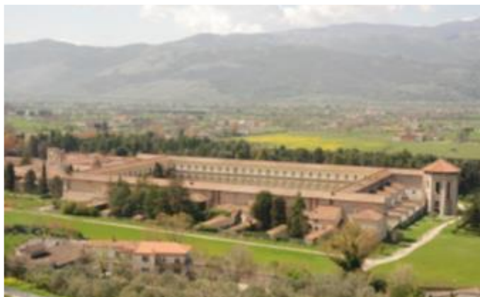
La chartreuse de Padula

Notre guide SERVRAIL parle allemand et français. Le voyage avec des guides locaux parlent le français ne peut pas être garanti.