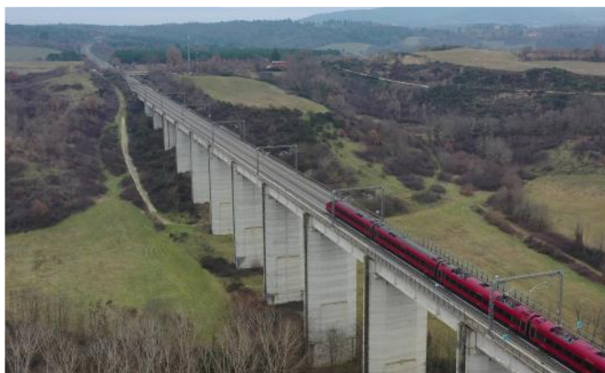
Avec le Frecciarossa en direction de la maison