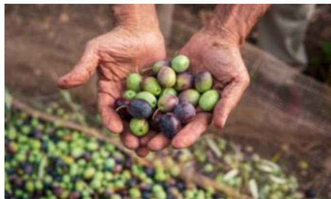
Récolte des olives