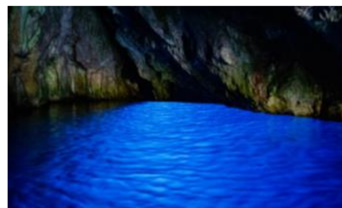
L'impressionnante Grotte bleue