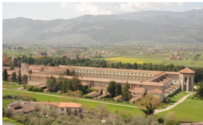
Die Karthause von Padula

Die kleine Ortschaft Padula besitzt eines der grösstesten Bauwerke Süditaliens, das Karthause – Kloster von San Lorenzo. An dem von Graf Tommaso Sanseverino, einem Anjou – Höfling, 1306 gegründeten Kloster hat man Jahrhunderte lang gebaut, stilprägend aber wurde die Barockzeit. Zur Zeit Napoleons war es eine Kaserne, während den Weltkriegen diente es als Straflager