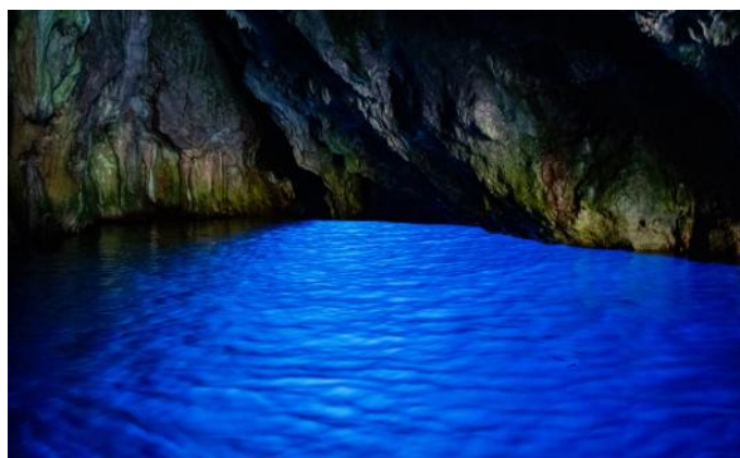
Die eindrucksvolle Blaue Grotte