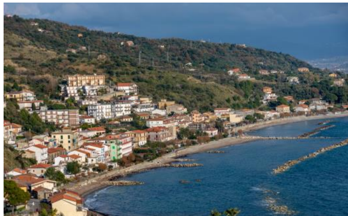
Das Dorf Pioppi

Wir fahren der Südküste des Cilento entlang. Abseits von touristischen Verkehrsströmen erleben wir einen der schönsten Küstenabschnitte Italiens. In Palinuro haben wir bei ruhigem Meer die Möglichkeit, die «Blaue Grotte» zu besichtigen. Nachmittags Weiterfahrt zum cilentanischen "Grand Canyon" mit dem Geisterdorf San Severino, das spektakulär auf einem Felsen erbaut wurde.