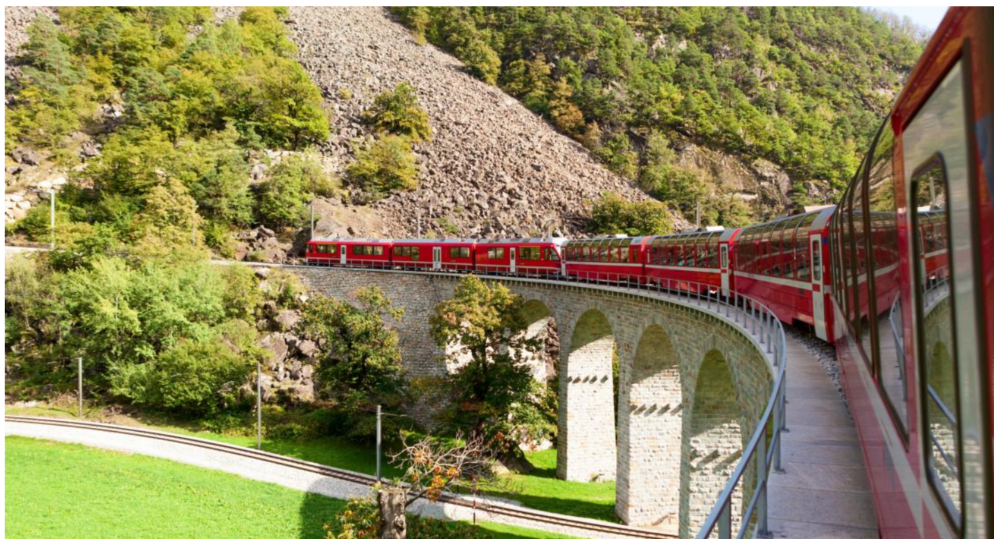
Une grande expérience, encore et toujours : Le voyage avec le chemin de fer de la Bernina