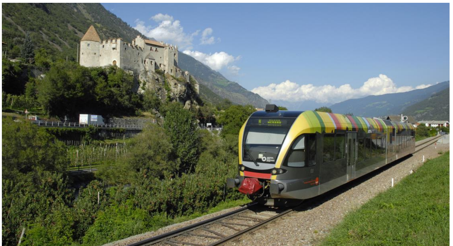
Voyage avec le train de Vinschgau à travers le pittoresque Val Venosta