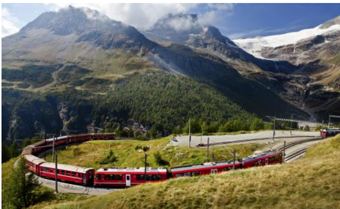
La ligne de la Bernina à Alp Grüm

Le chemin de fer à voie métrique de Bolzano au Plateau de Renon a été ouvert en 1907 et était initialement composé de trois parties. Depuis la place Walther (266 m), au centre de Bolzano, le train a circulé comme un tramway jusqu'à la station du Renon. Ensuite, une locomotive à crémaillère a poussé le tram sur la voie à crémaillère de 4,1 km de long jusqu'à L'Assunta (1176 m), puis il a continué sur la ligne d'adhérence via Stella (1251 m) jusqu'à Collalbo (1191 m). Après un grave accident en 1964, la ligne à crémaillère a été fermée et remplacée par un téléphérique vers Soprabolzano. Aujourd'hui, des trains électriques modernisés (anciennement chemin de fer de Trogen en Suisse) circulent entre L'Assunta - Soprabolzano - Collalbo.