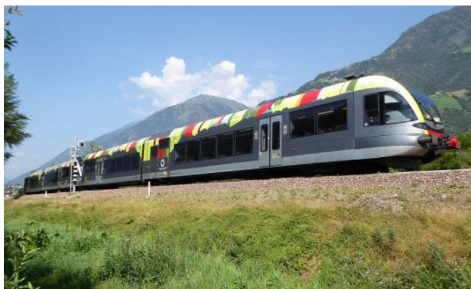
Train moderne dans la vallée de Venosta (Photo *)