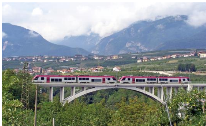
Vallée de Non