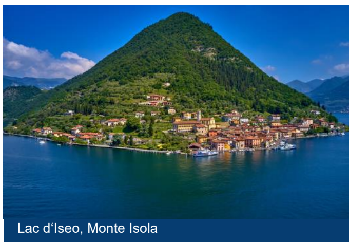
Lac d'Iseo, Monte Isola