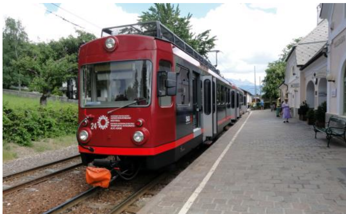
Le train du Renon dans la gare de Collalbo (Photo *)

La ligne à écartement normal de 105 km et en traction autonome, de Brescia à Edolo via Iseo, a été mise en service entre 1885 et 1909. Exploitée à l'origine par la société ferroviaire privée SNFT, l'exploitation se fait actuellement par la société ferroviaire Trenord. C'est une entreprise commune entre la compagnie ferroviaire nationale FS et Ferrovie Nord Milano et exploite aujourd'hui tous les services régionaux dans la région de Lombardie. Il existe un service régulier dense sur la ligne. Une particularité de cette ligne est le train des saveurs (Treno dei Saporì). Ce train touristique se compose d'une locomotive diesel et de vieilles voitures voyageurs, qui ont été aménagées en voitures-restaurants. Un menu gastronomique est servi pendant le trajet.